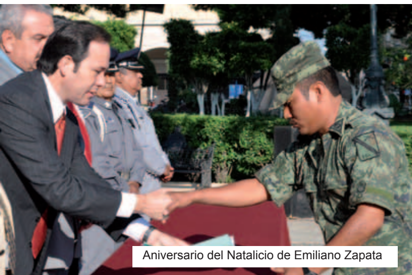
Aniversario del Natalicio de Emiliano Zapata