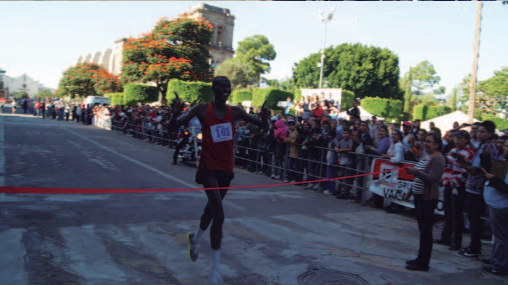
Ganador del Primer Medio Maratón