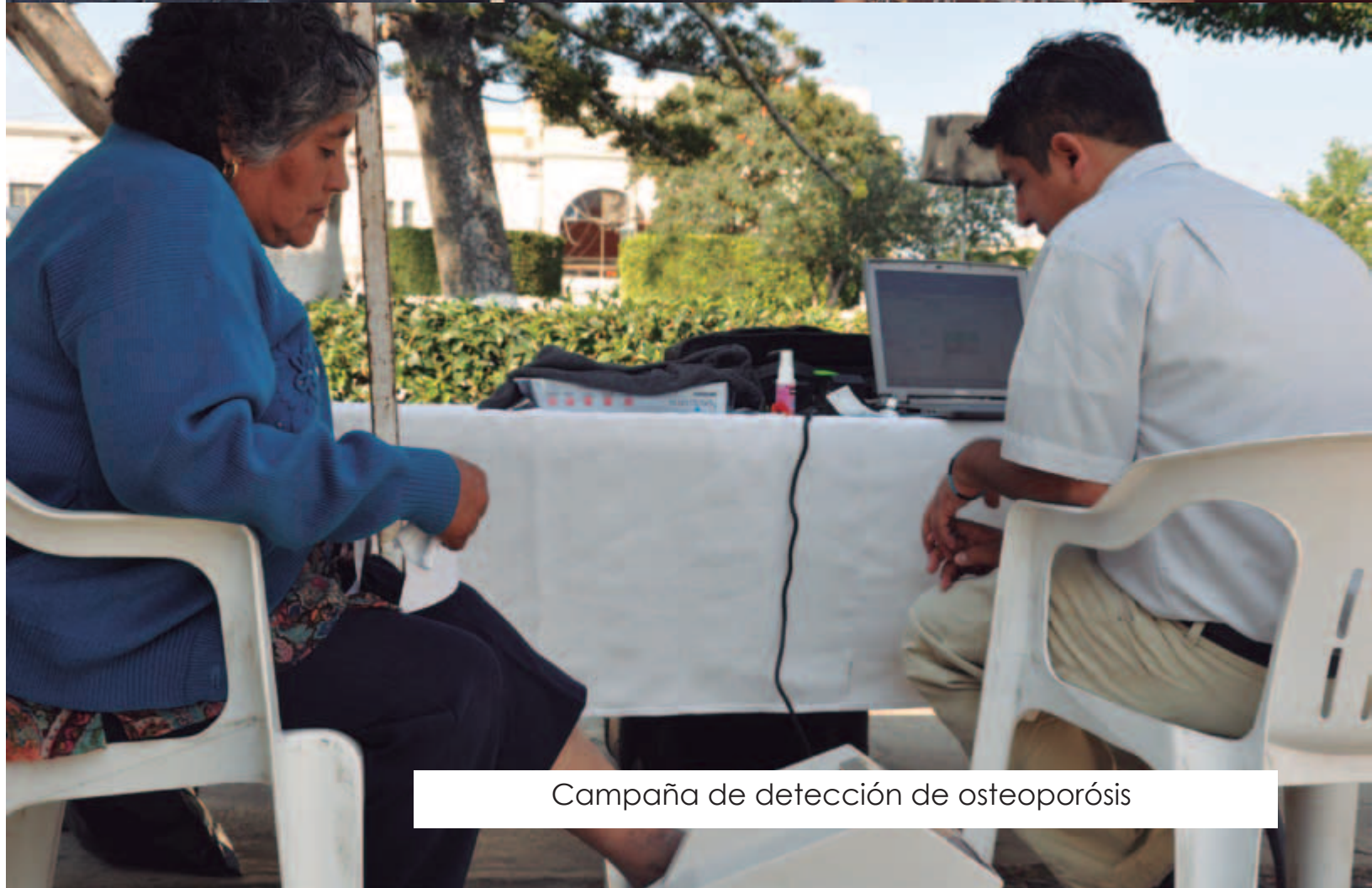
Campaña de detección de osteoporosis