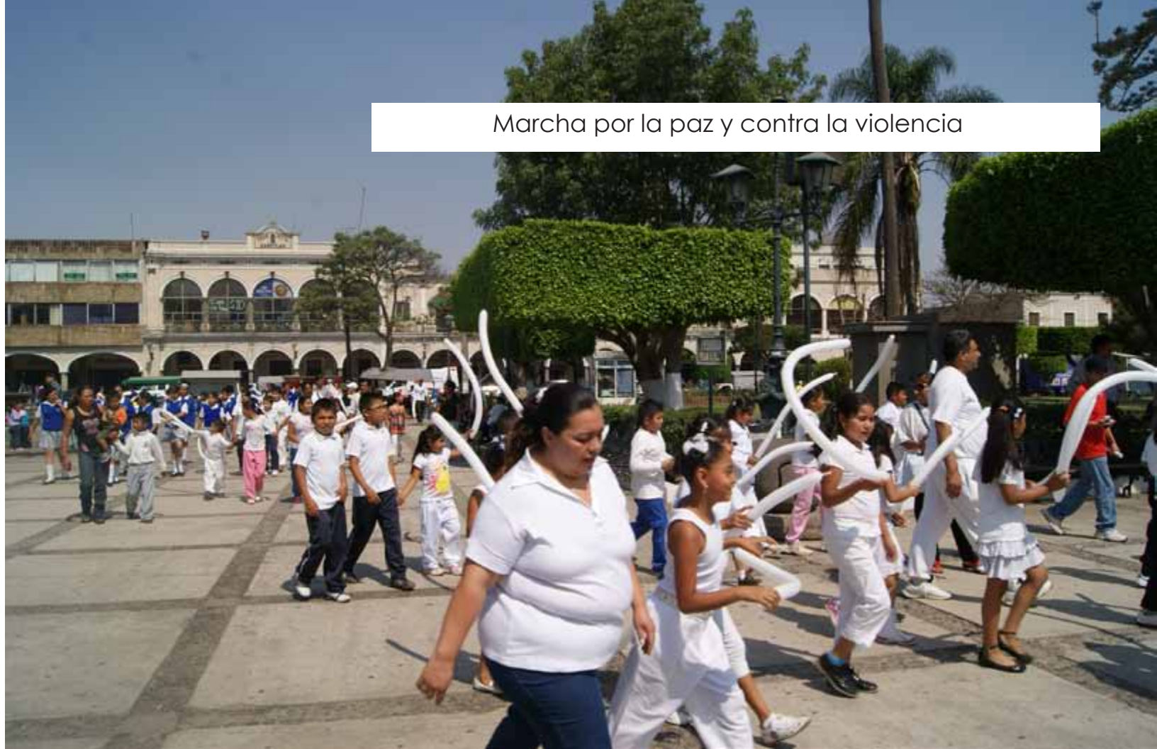
Marcha por la paz y contra la violencia