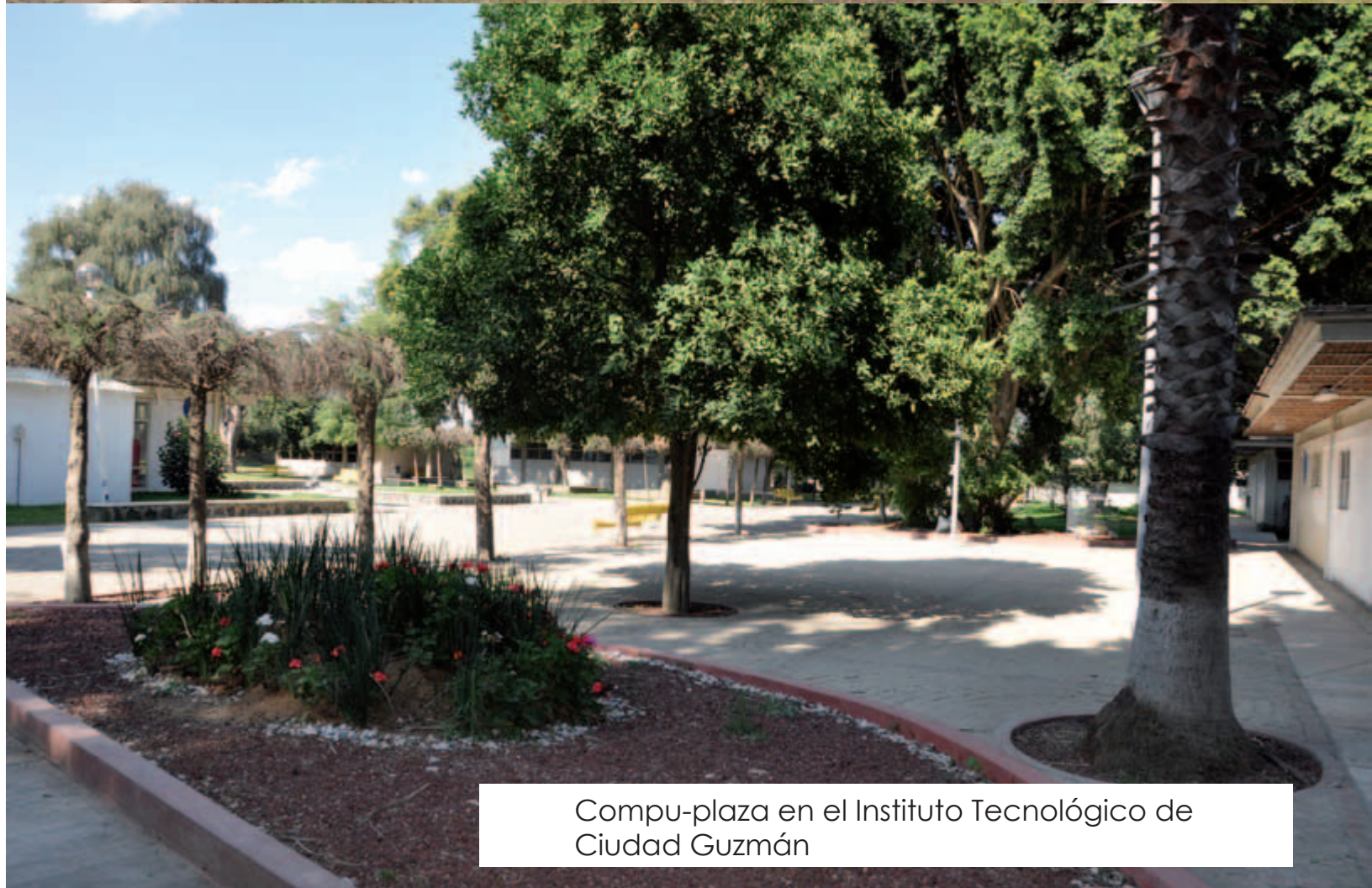
Compu-plaza en el Instituto Tecnológico de Ciudad Guzmán