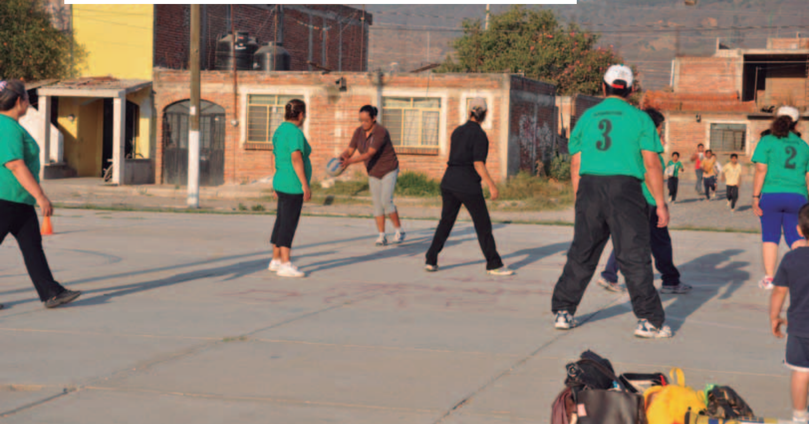
Programa de Activación Física