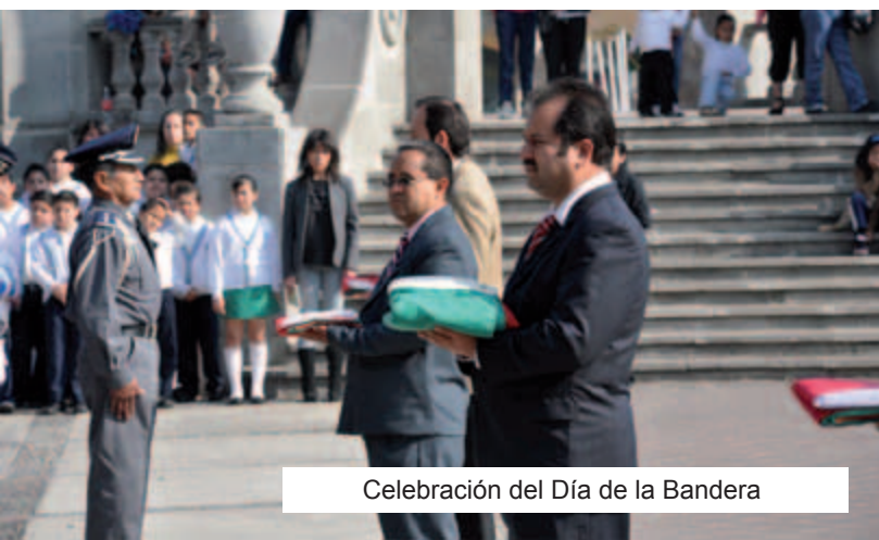
Celebración del Día de la Bandera