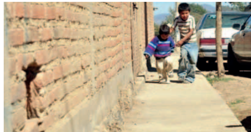
Trabajando en coordinación con diversas áreas del Gobierno de Zapotlán El Grande, Anselmo Ábrica Chávez, presidente municipal, ha recorrido calles, barrios, colonias y delegaciones a través del programa "El Presidente en tu colonia Cumple" de Participación Ciudadana, escuchando las peticiones de los vecinos y dando solución a los problemas que les afectan.