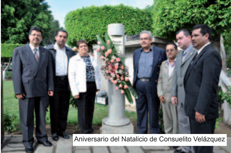
Aniversario del Natalicio de Consuelito Velázquez