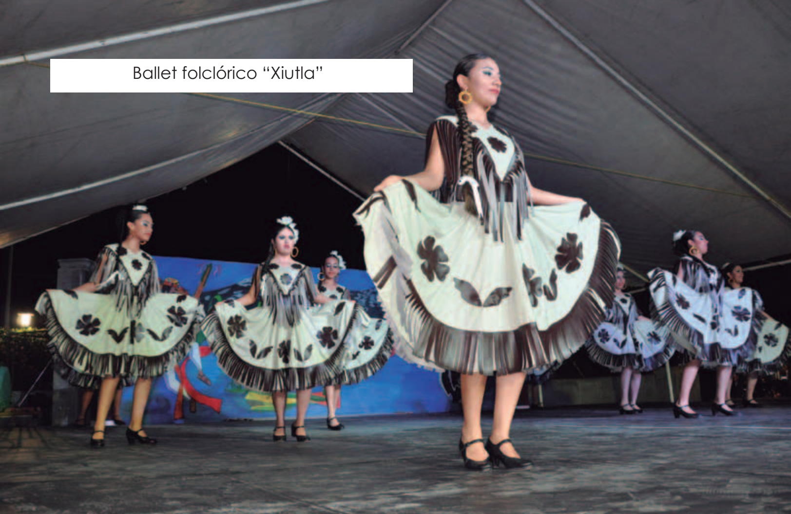
Ballet folclórico "Xiutla"