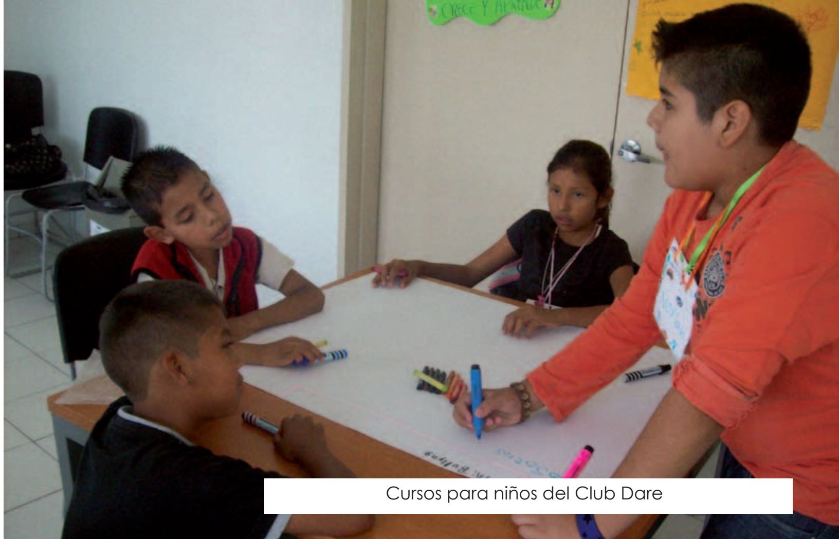
Cursos para niños del Club Dare