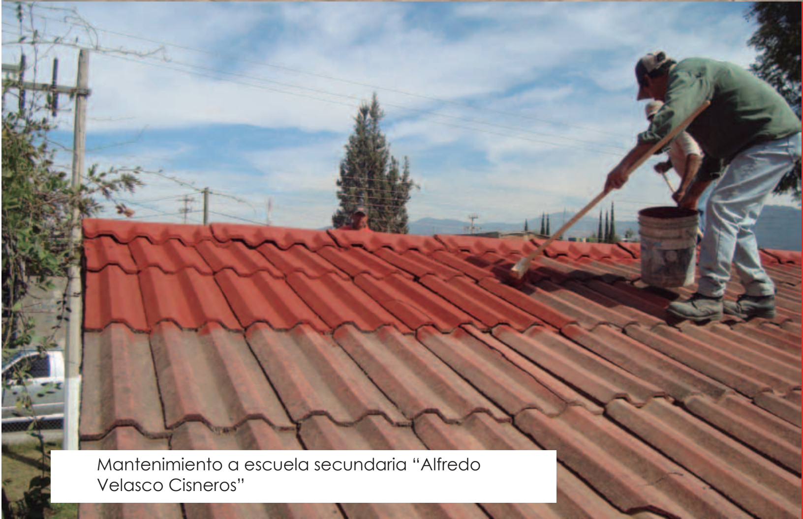
Mantenimiento a escuela secundaria "Alfredo Velasco Cisneros"