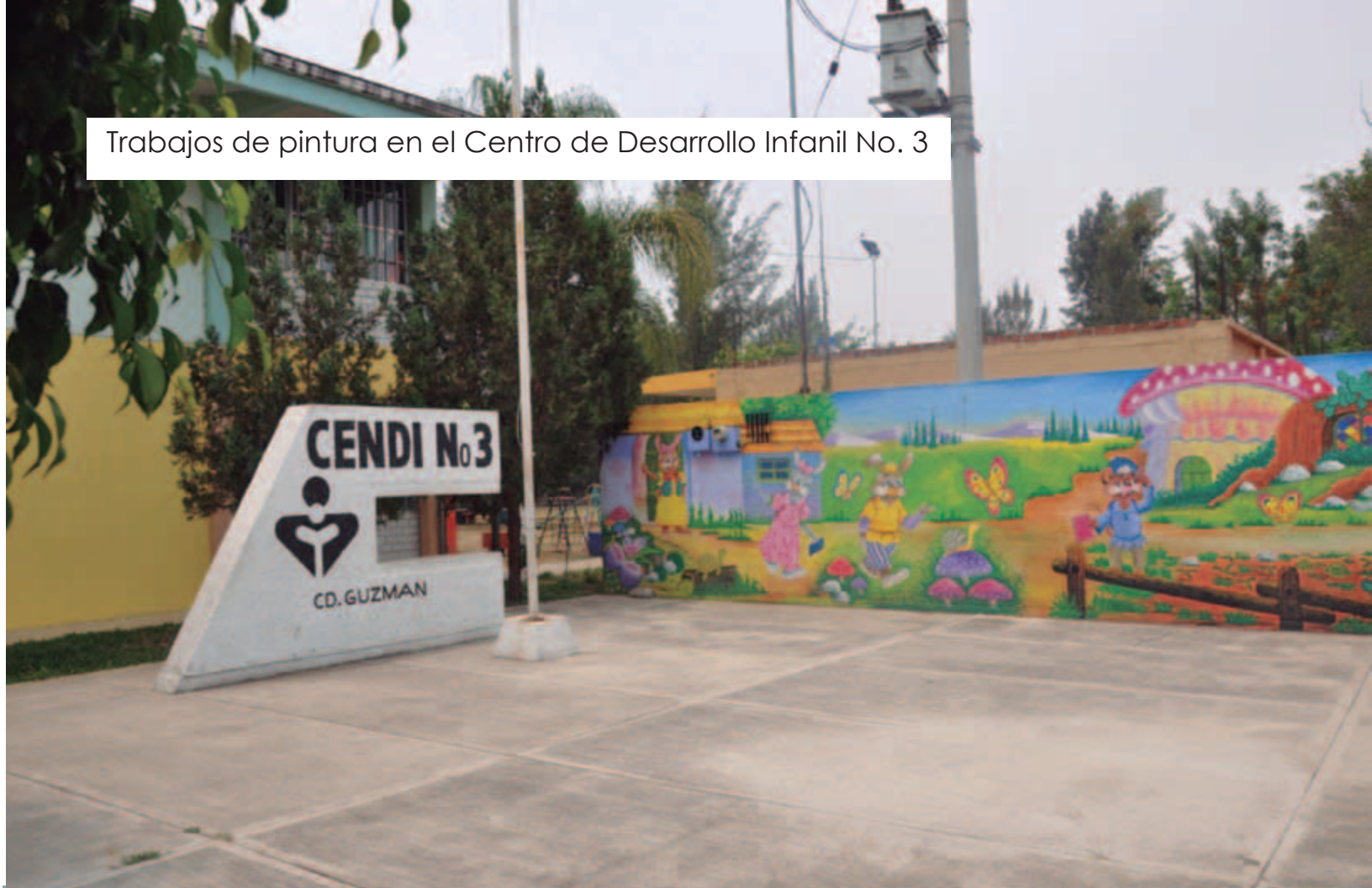
Trabajos de pintura en el Centro de Desarrollo Infantil No. 3