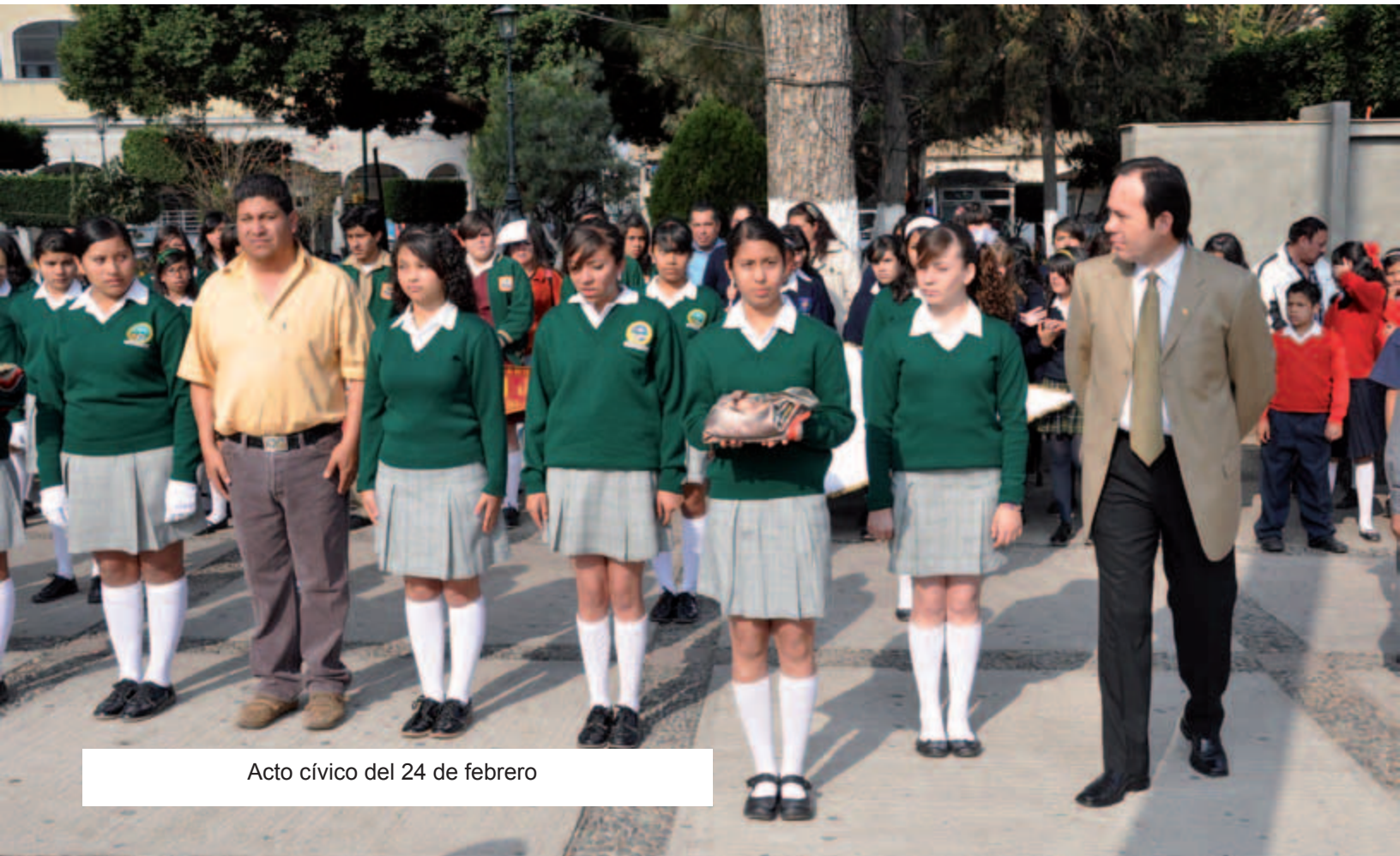
Acto cívico del 24 de febrero