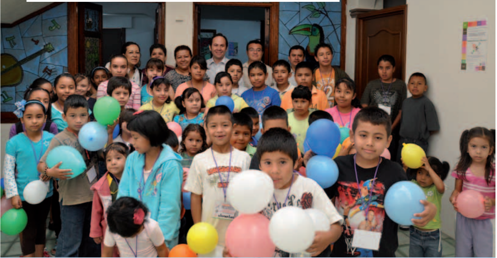
Taller "Conozcamos mis derechos y obligaciones"