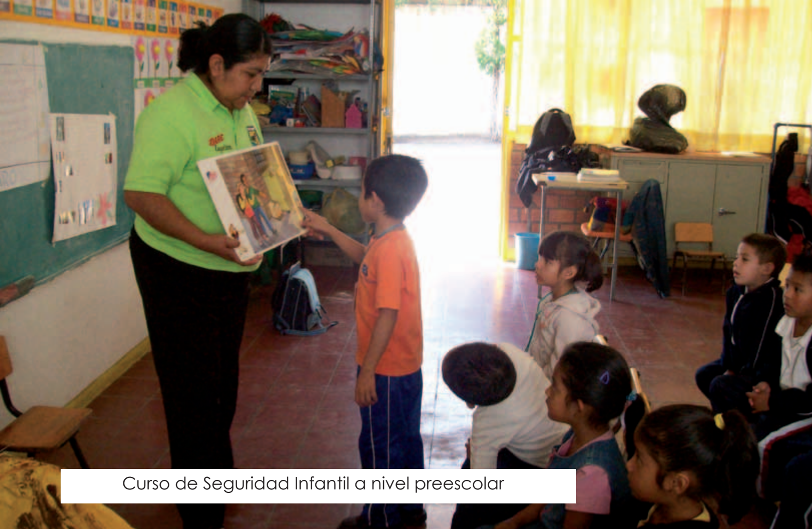
Curso de Seguridad Infantil a nivel preescolar