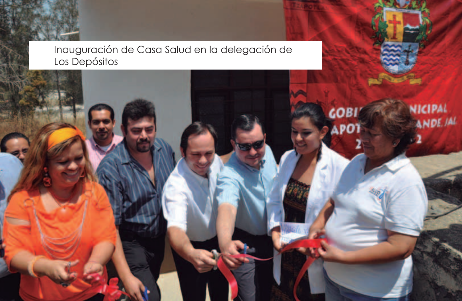
Inauguración de Casa Salud en la delegación de Los Depósitos