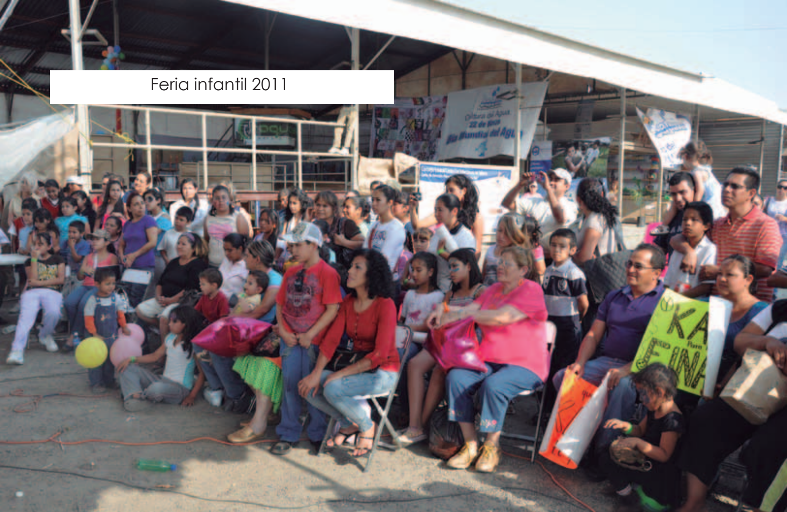
Feria infantil 2011