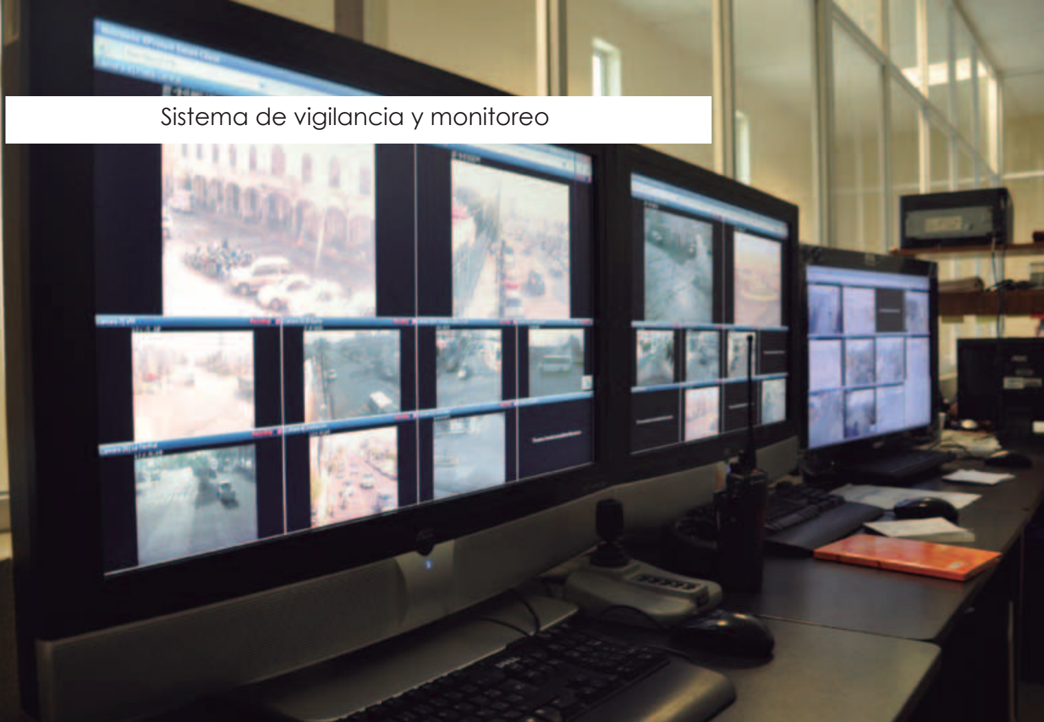
Sistema de vigilancia y monitoreo