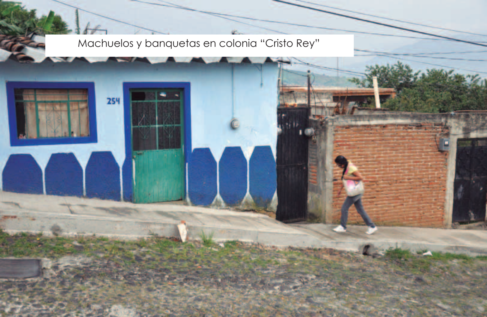
Machuelos y banquetas en colonia "Cristo Rey"