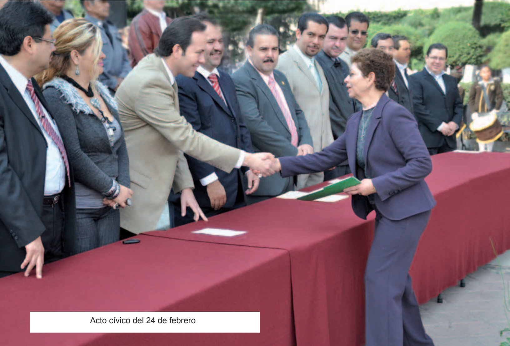
Acto cívico del 24 de febrero