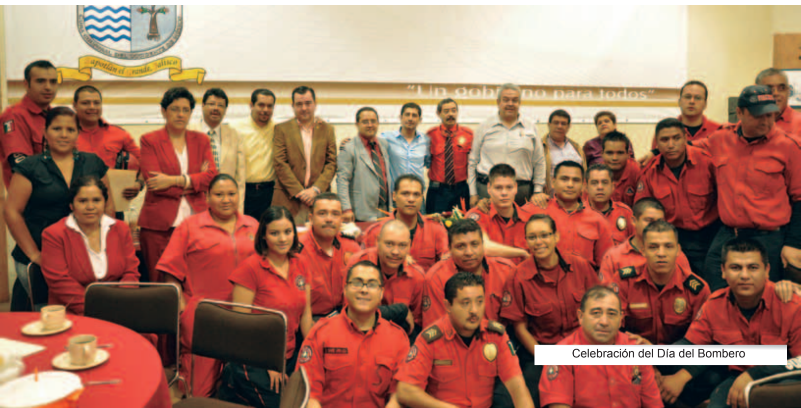
Celebración del Día del Bombero