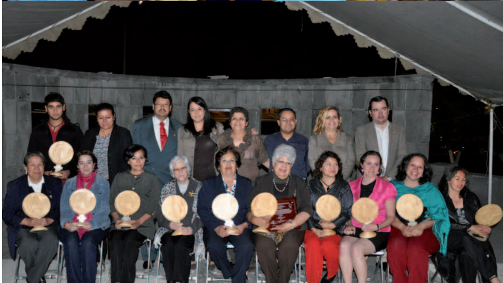
Reconocimiento a mujeres destacadas