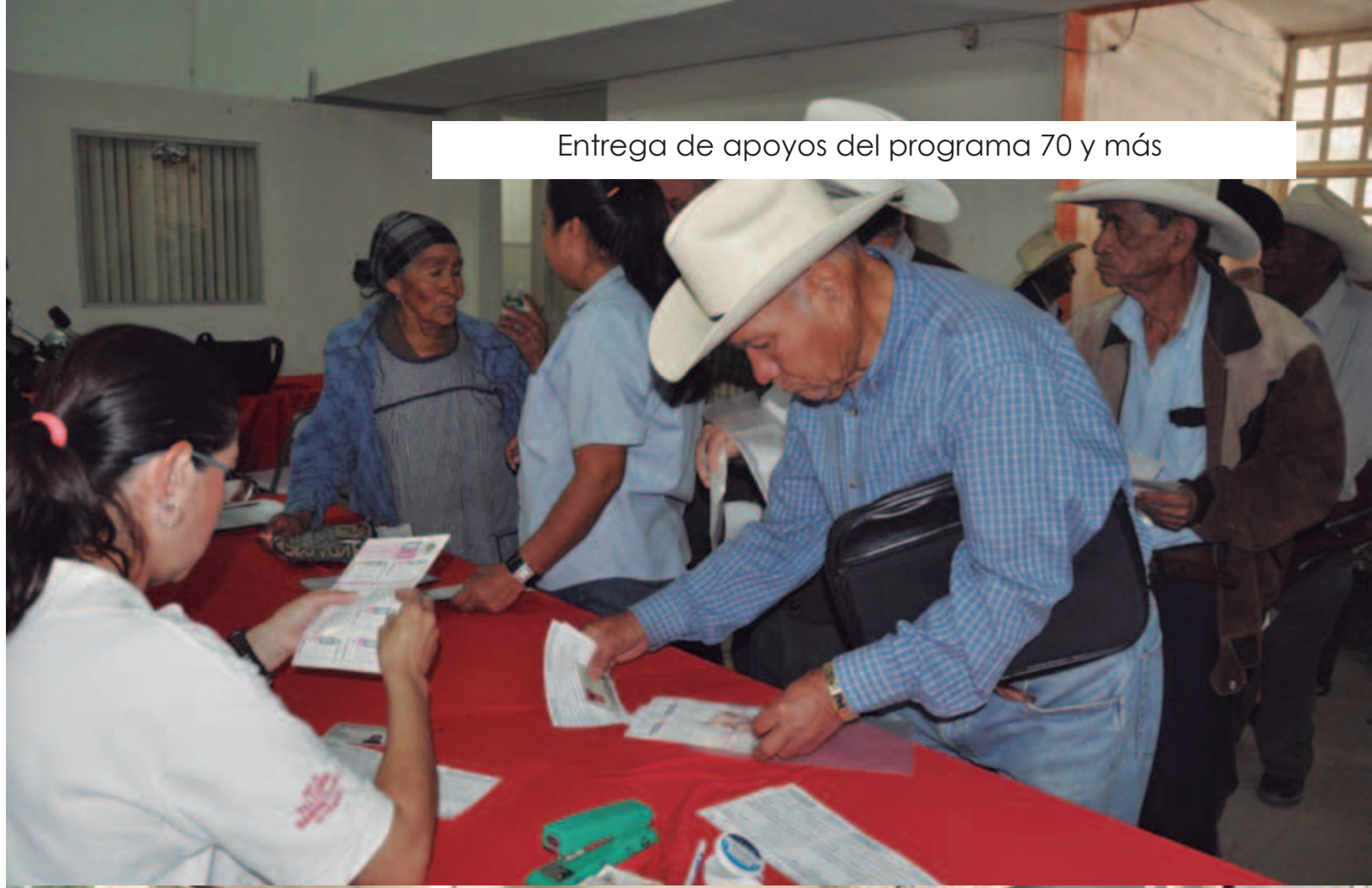
Entrega de apoyos del programa 70 y más