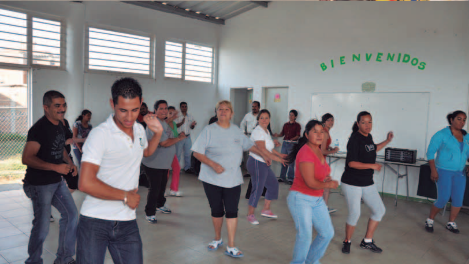
Programa "Por una mejor calidad de vida"