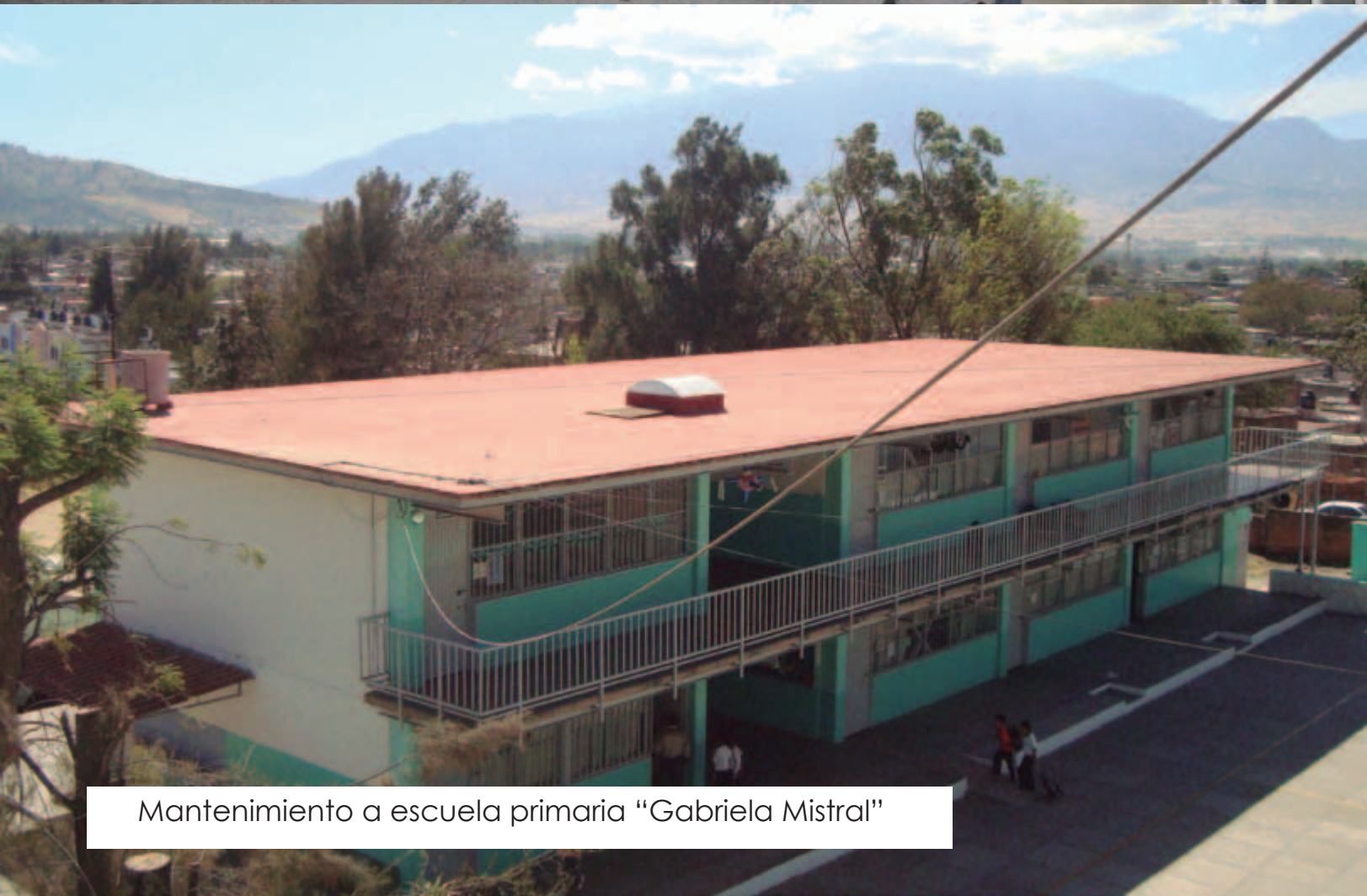
Mantenimiento a escuela primaria "Gabriela Mistral"