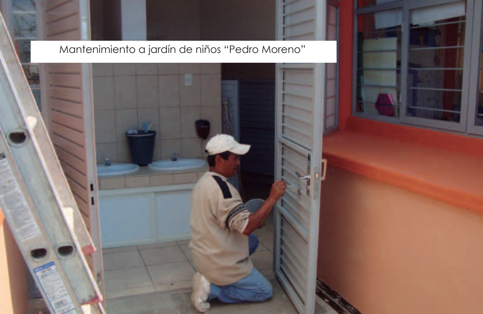
Mantenimiento a jardín de niños "Pedro Moreno"