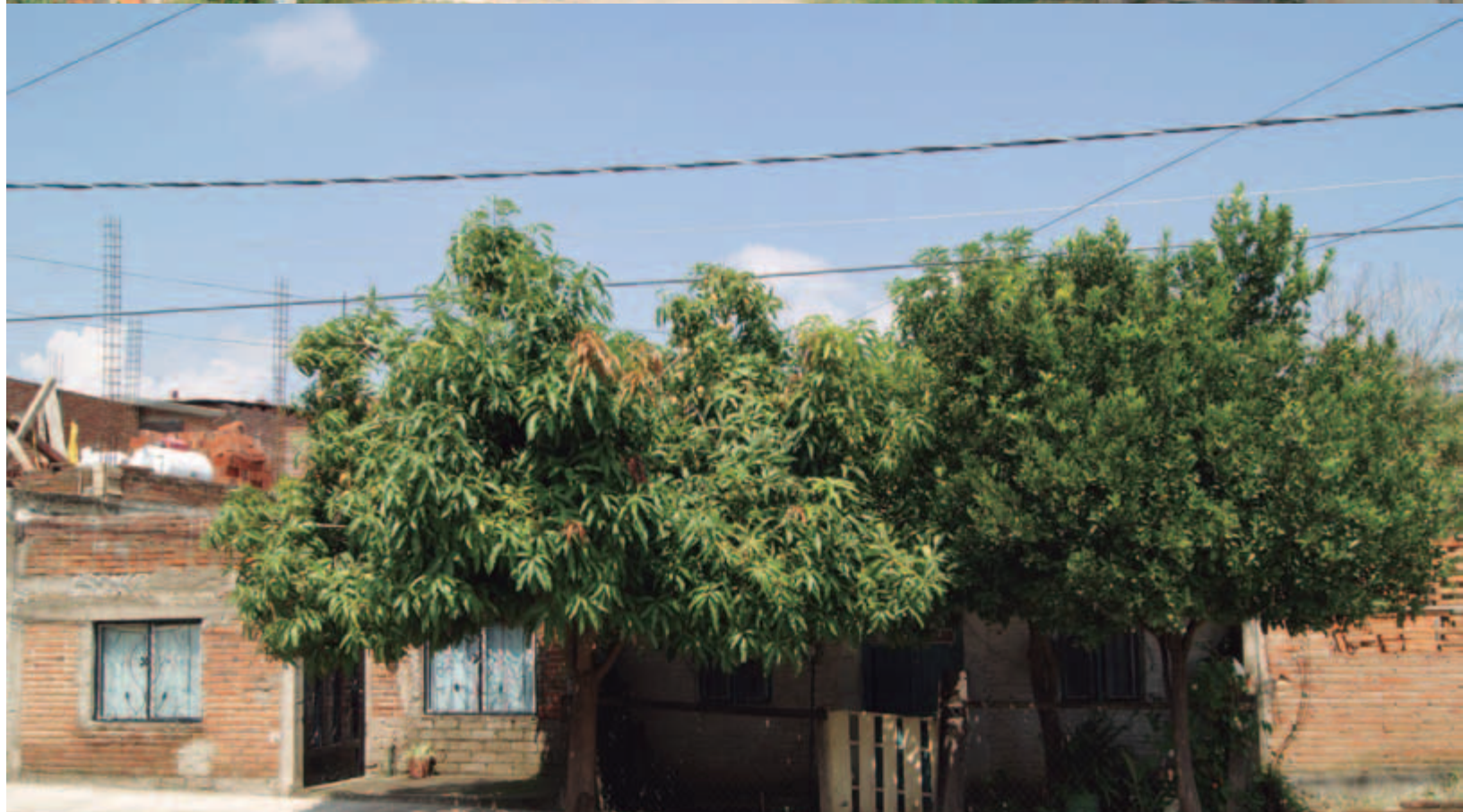
Machuelos y banquetas en colonia "Pastor de Arriba"