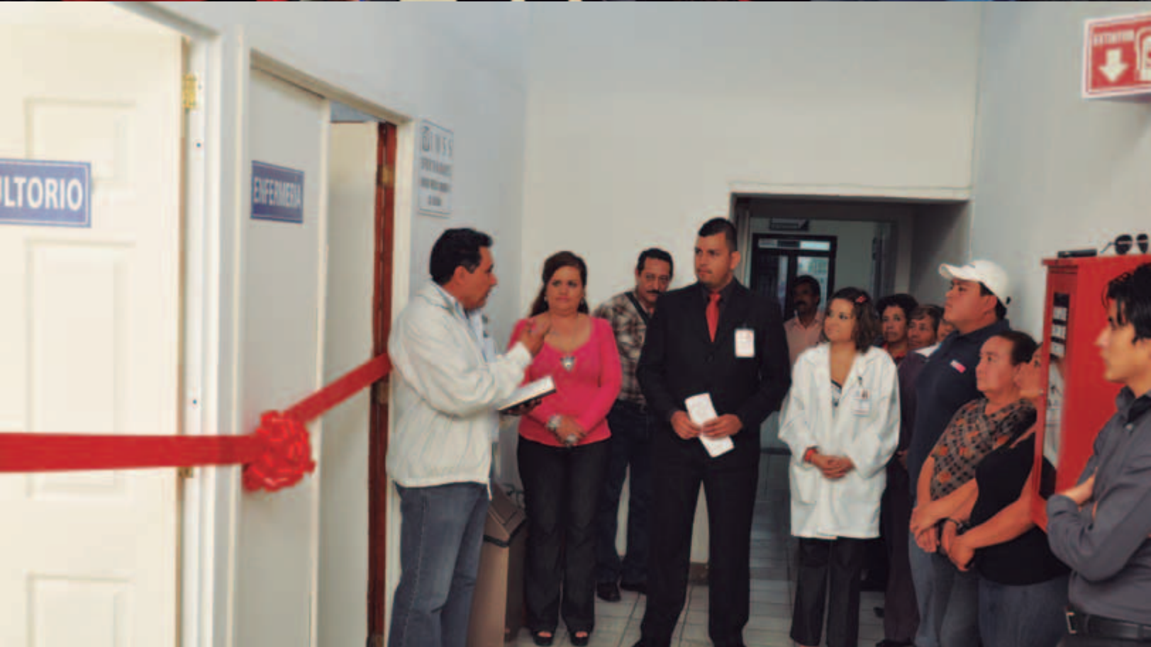
Inauguración de consultorios IMSS Oportunidades en el Palacio Municipal