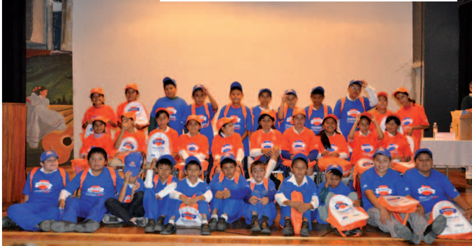
Entrega de kit a Guardianes Panamericanos