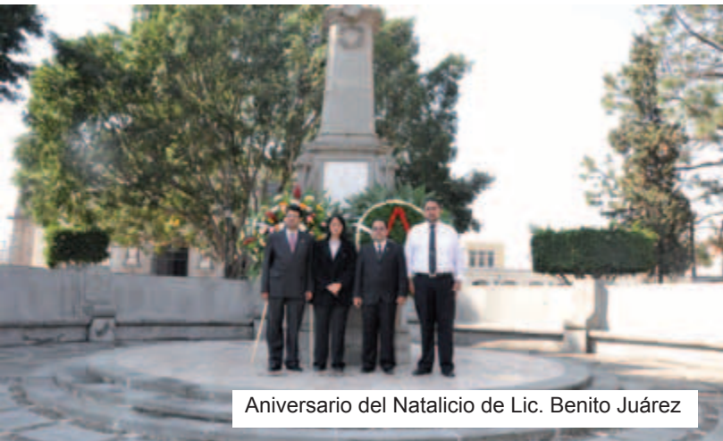
Aniversario del Natalicio de Lic. Benito Juárez