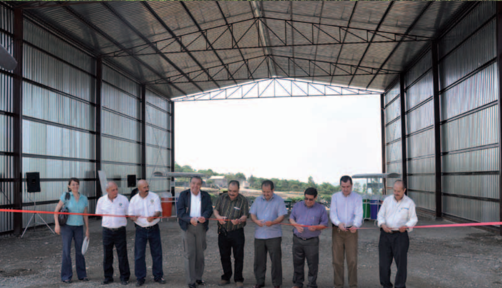
Nave para separación de residuos