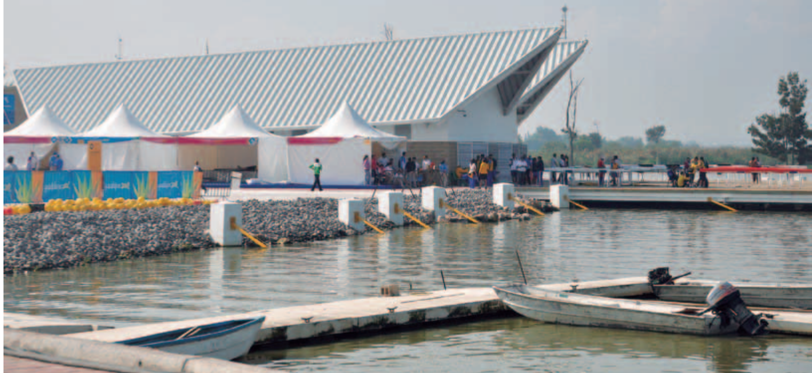
Pista de Remo y Canotaje