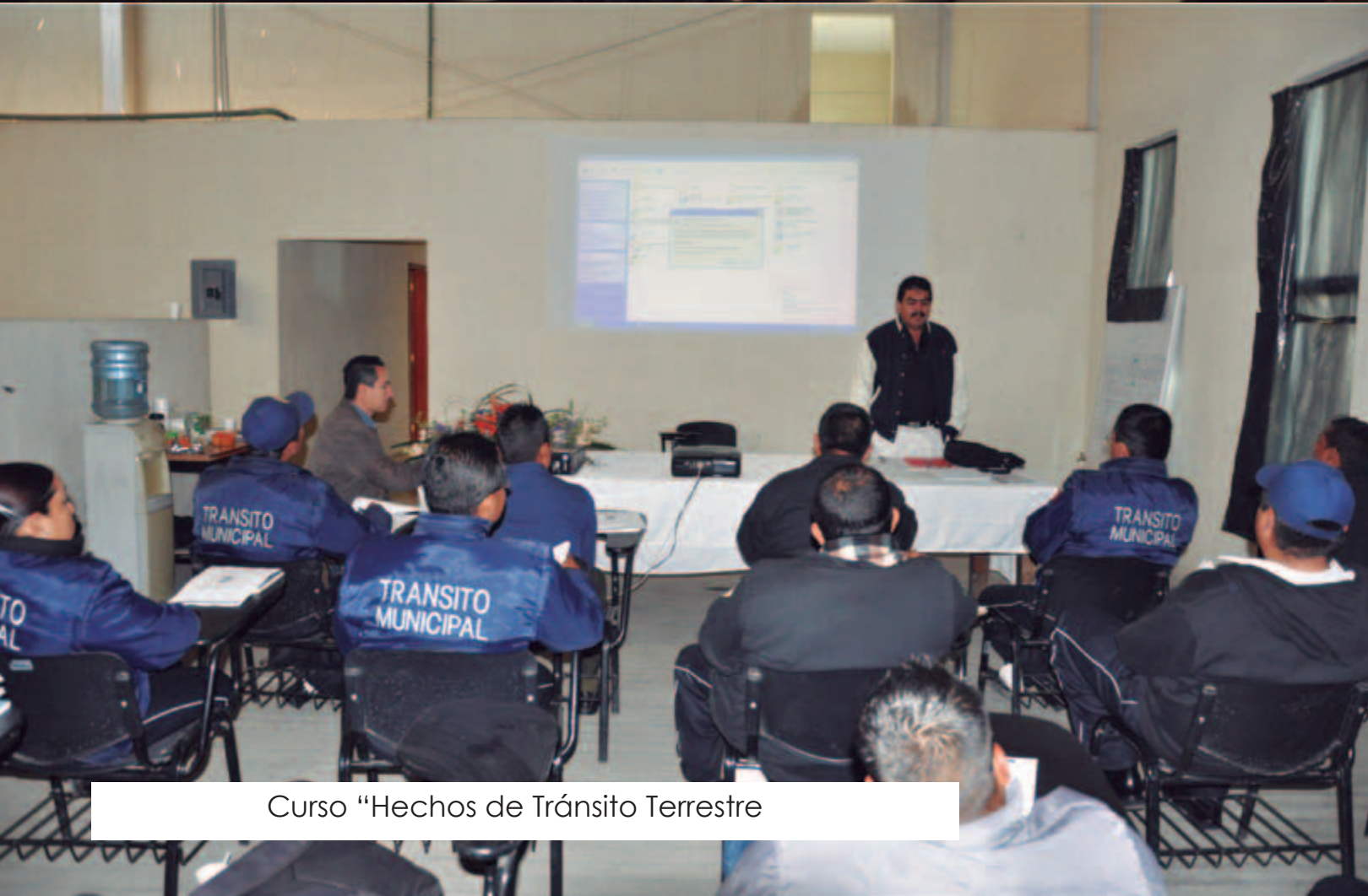
Curso "Hechos de Tránsito Terrestre"