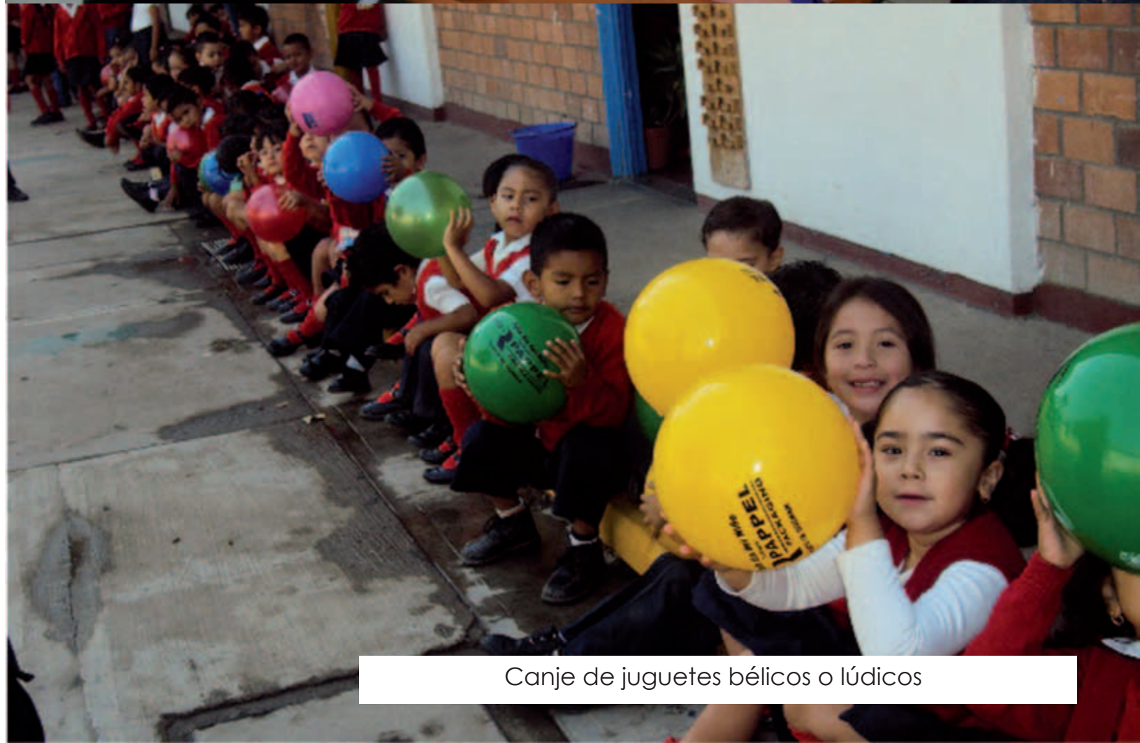
Canje de juguetes bélicos o lúdicos