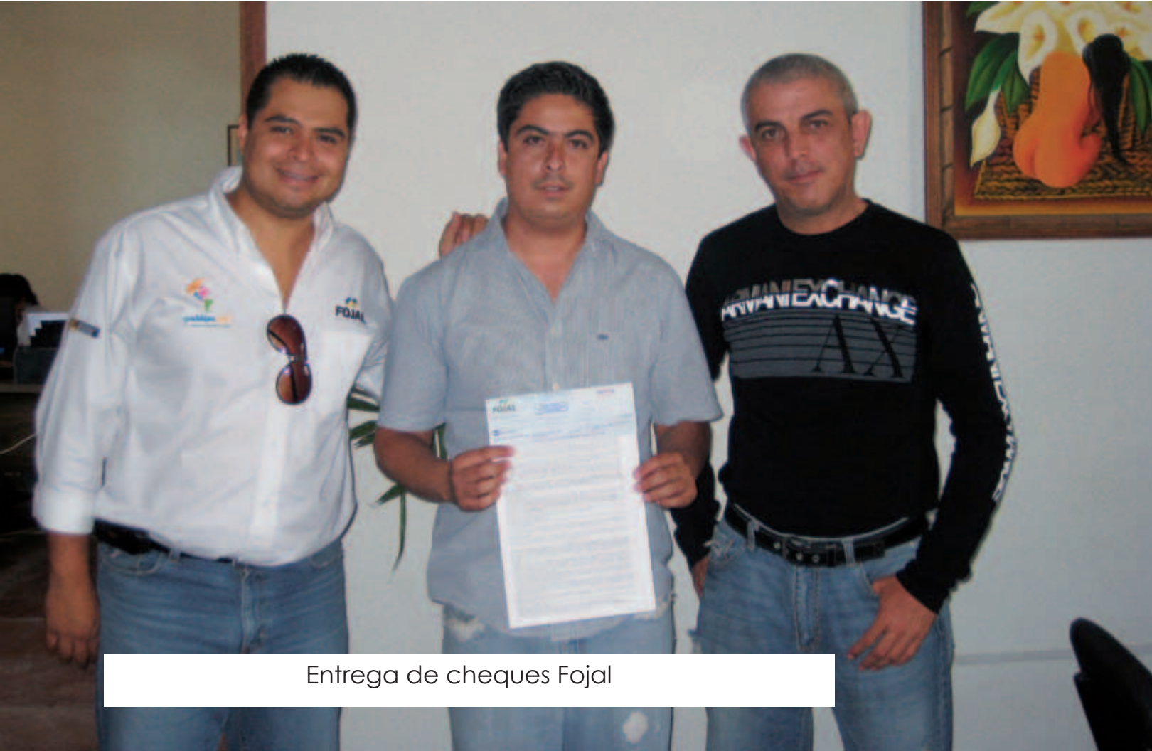
Entrega de cheques Fojal