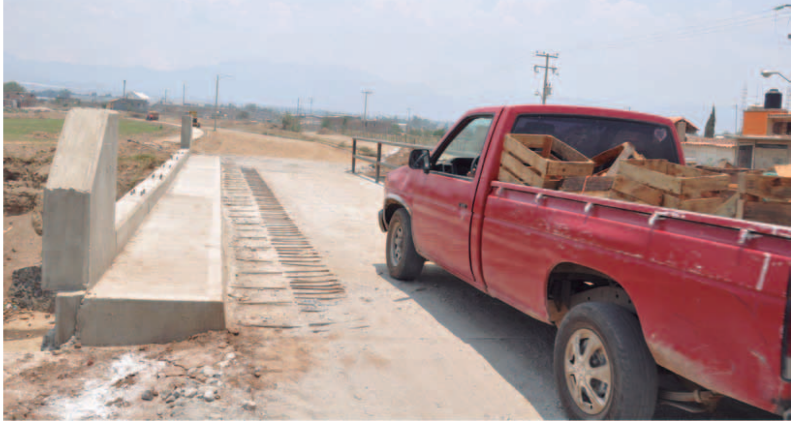
Puente Saca Cosechas Arroyo Volcanes-Apaxtepec