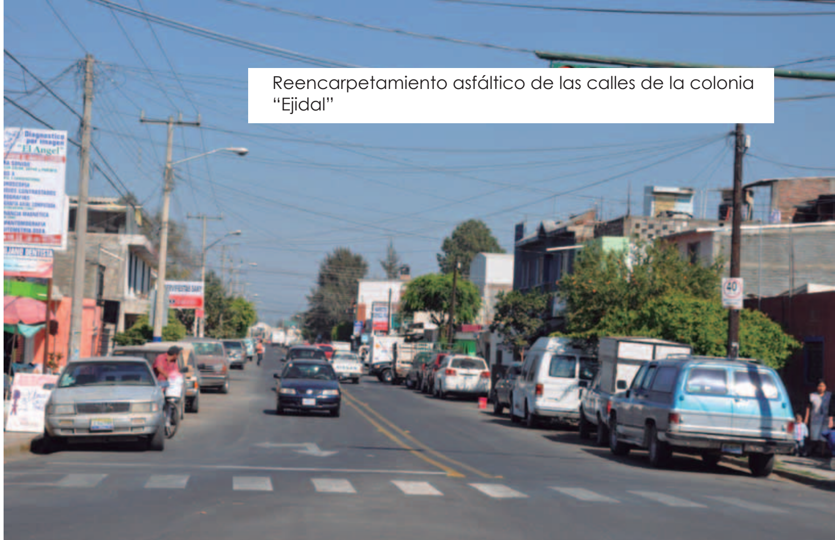
Reencarpentamiento asfáltico de las calles de la colonia "Ejidal"