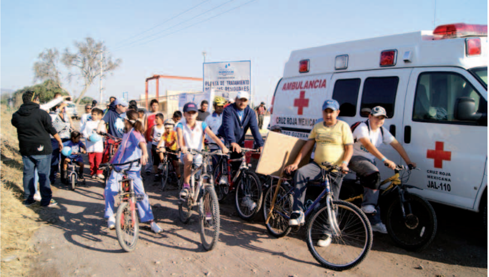
Celebración del Día Mundial del Agua