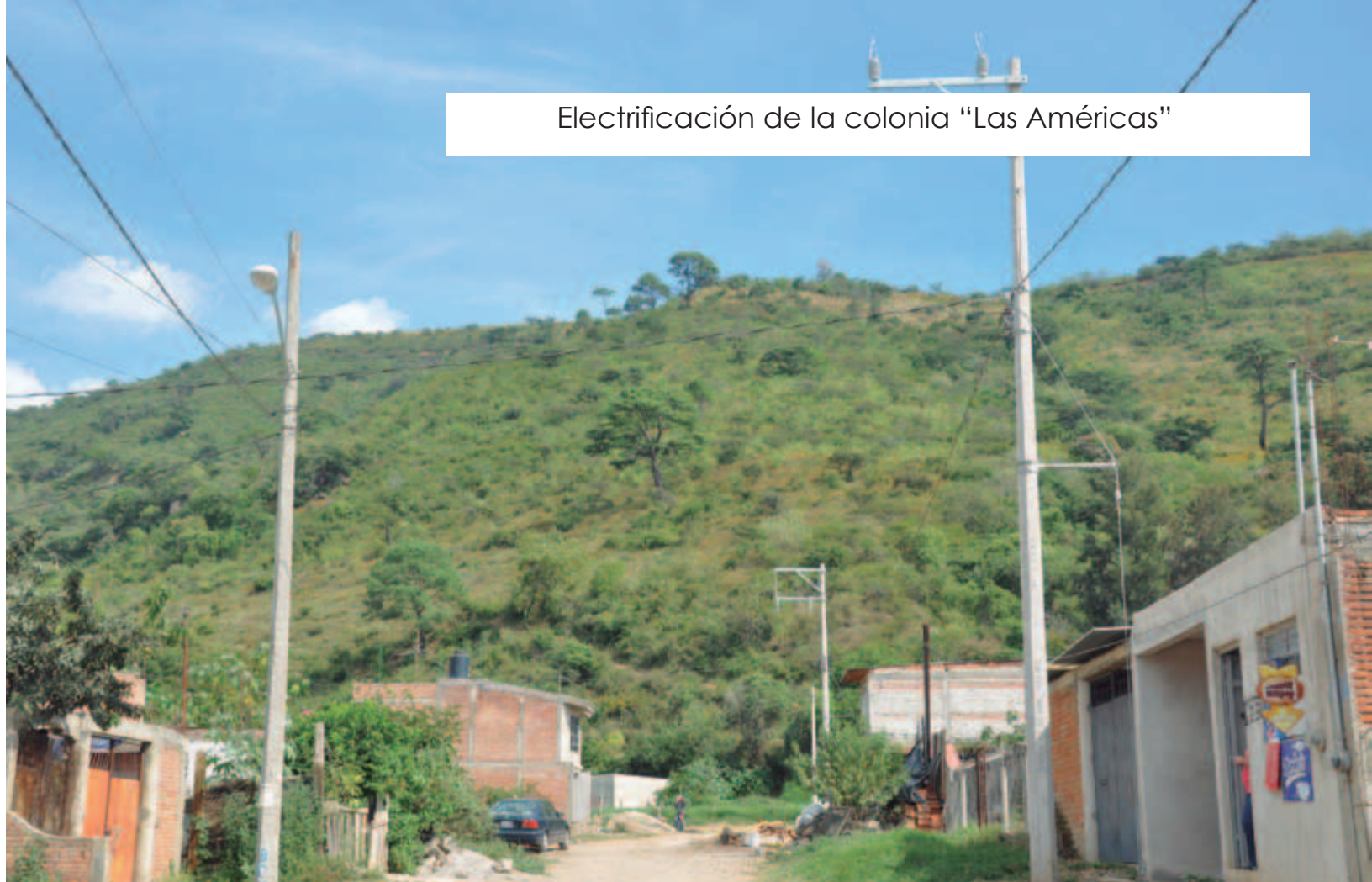
Electrificación de la colonia "Las Américas"