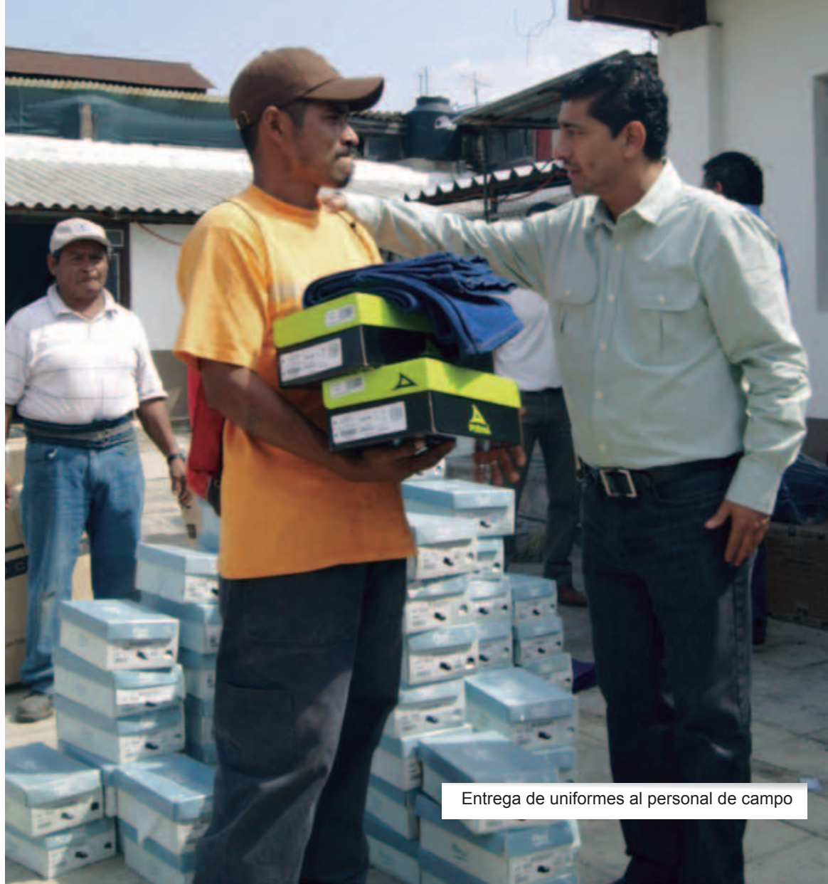
Entrega de uniformes al personal de campo