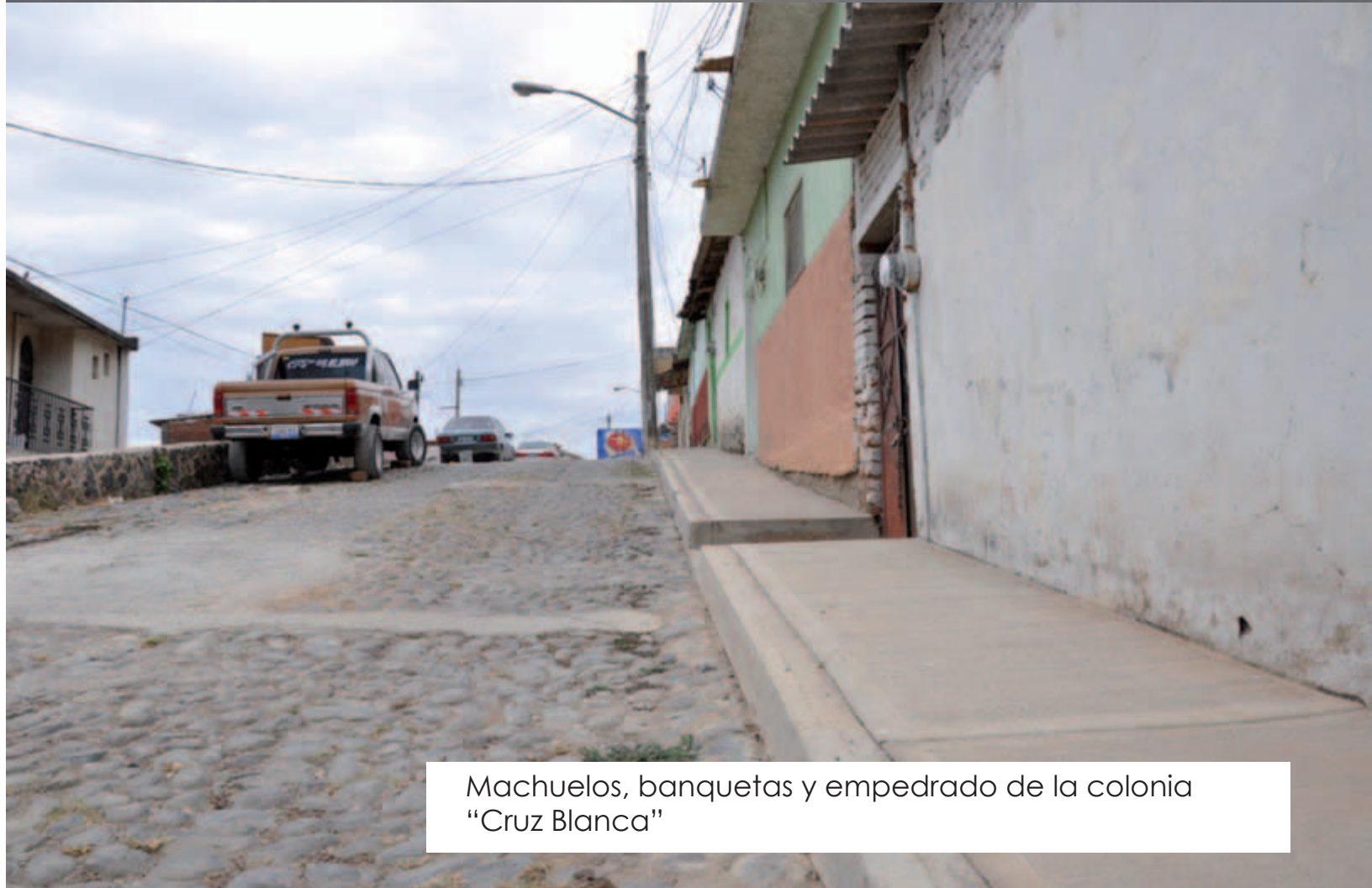
Machuelos, banquetas y empedrado de la colonia "Cruz Blanca"