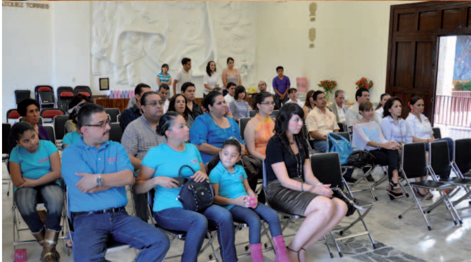
Entrega de "Distintivo M"