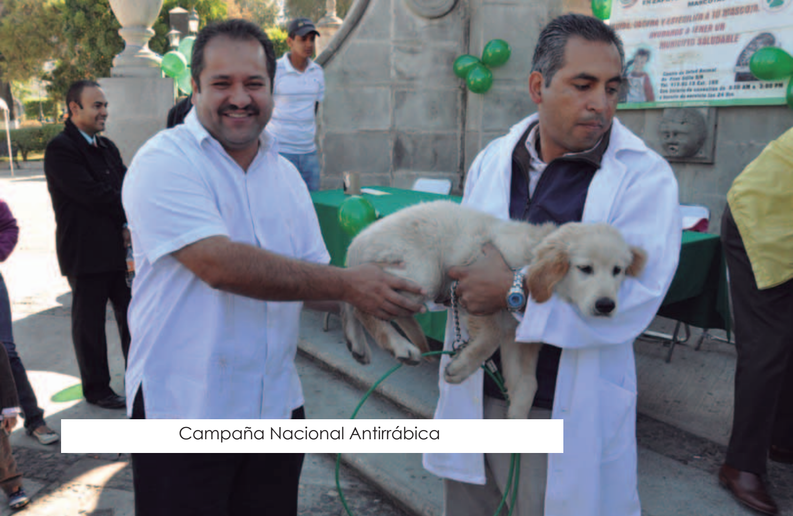
Campaña Nacional Antirrábica