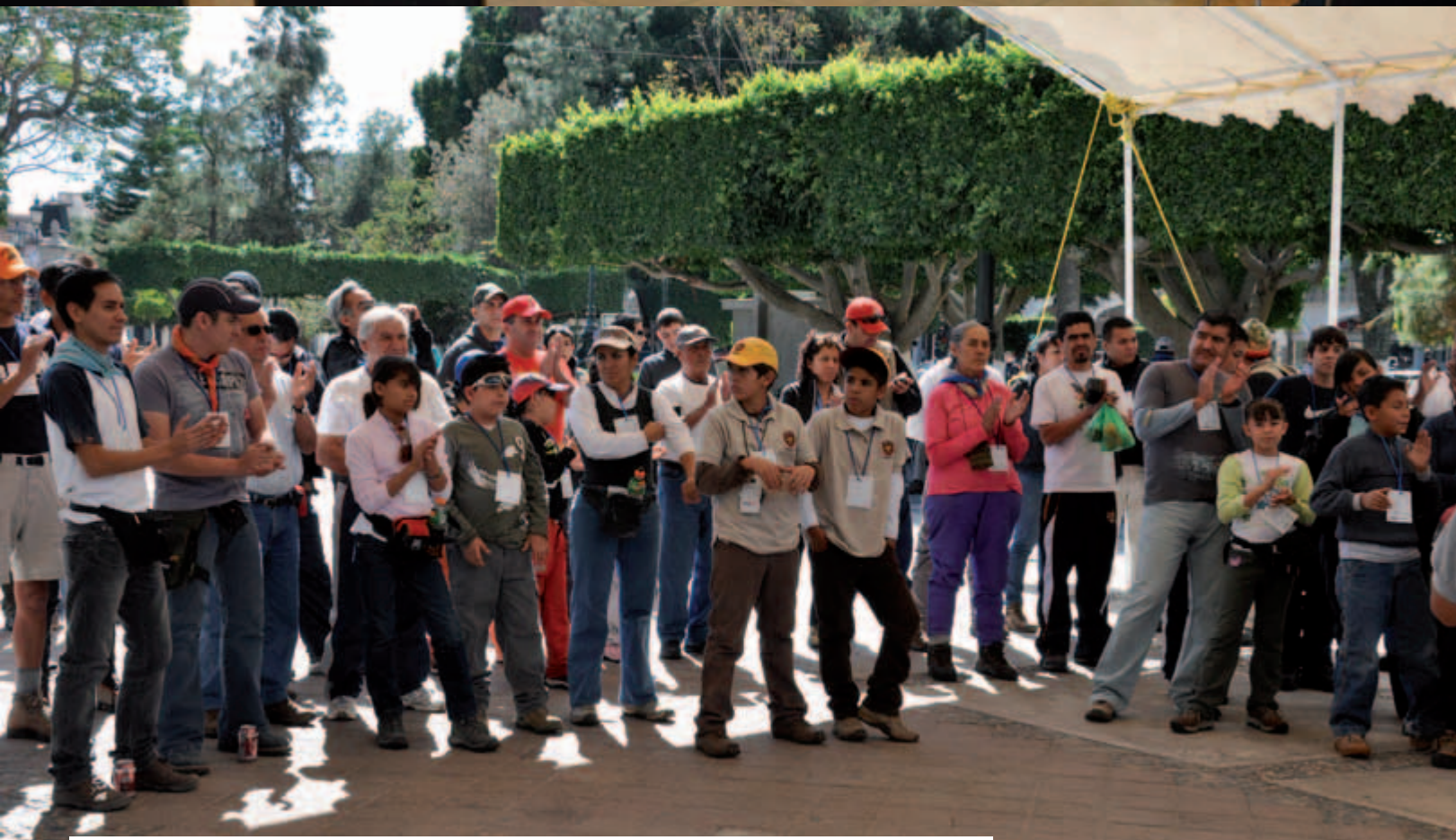
Recepción de Confraternidad de Montañistas