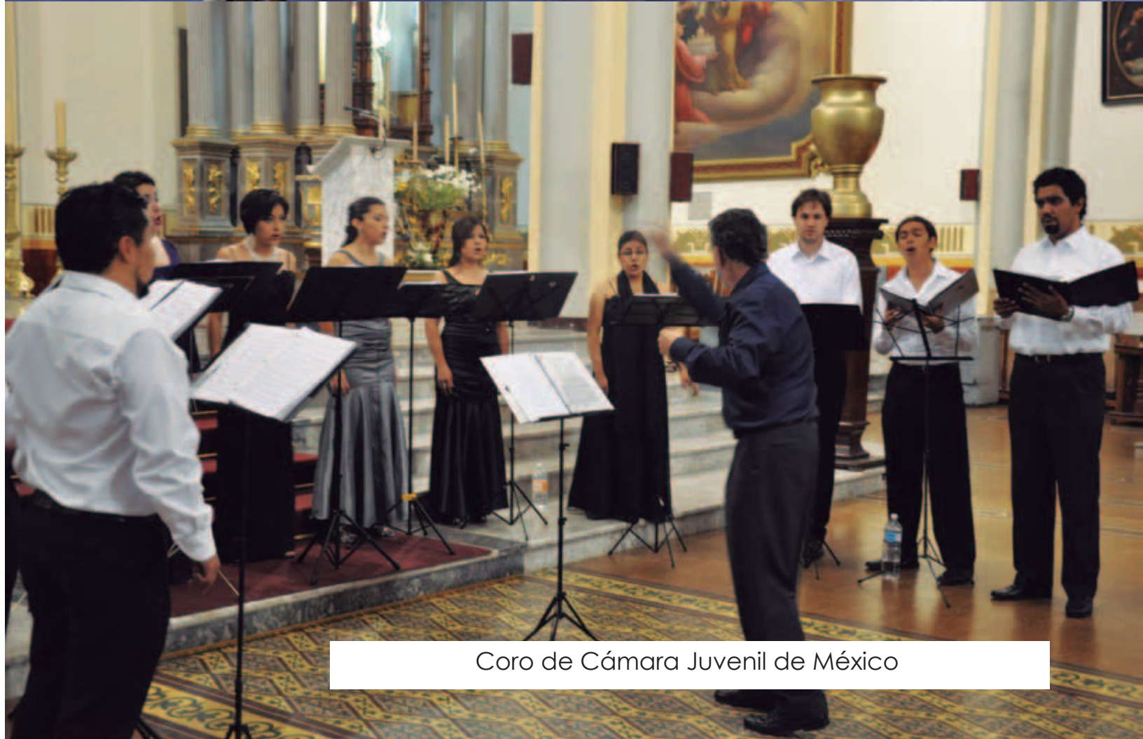
Coro de Cámara Juvenil de México