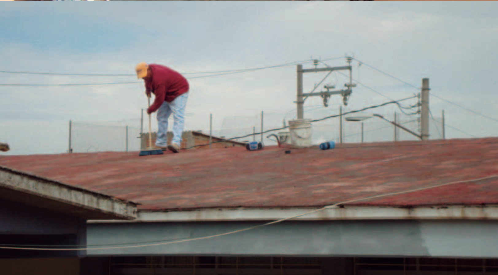
Mantenimiento a escuela telesecundaria "Juan José Arreola"