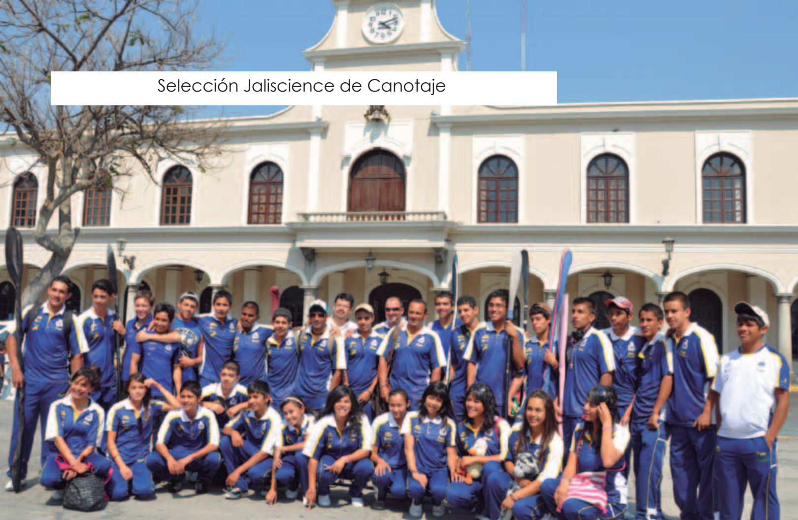
Selección Jalisciense de Canotaje