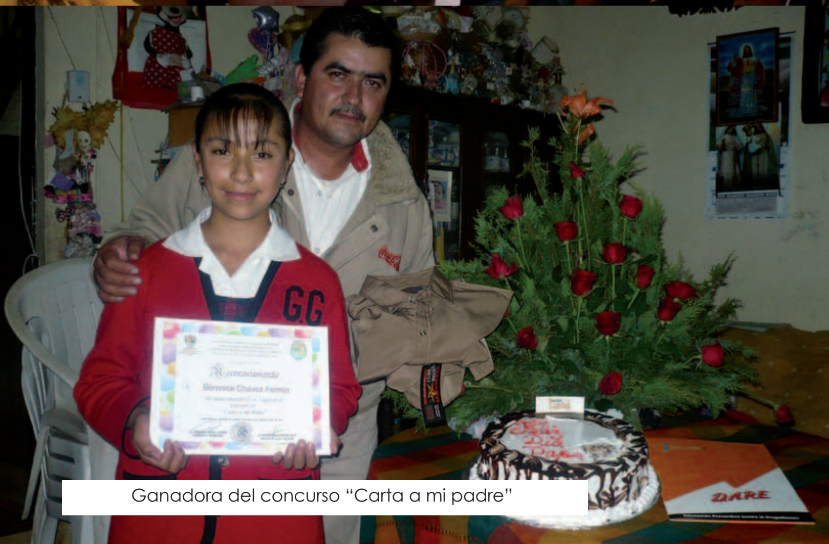
Ganadora del concurso "Carta a mi padre"