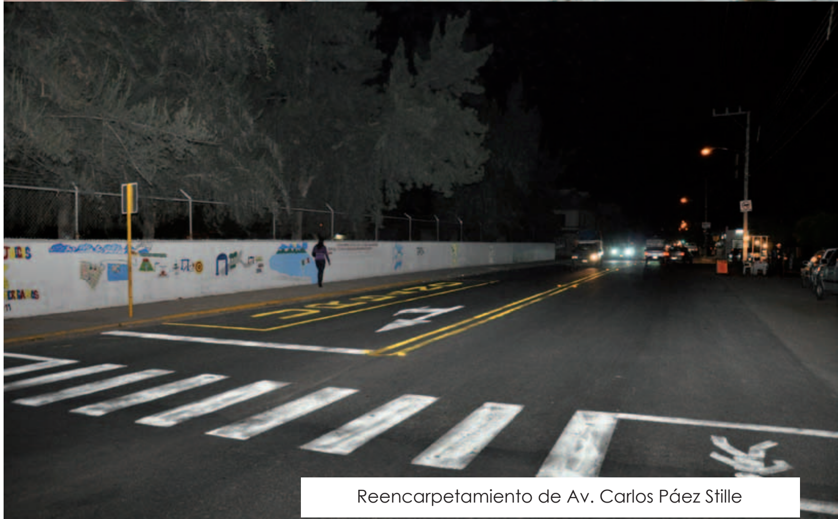
Reencarpetamiento de Av. Carlos Páez Stille