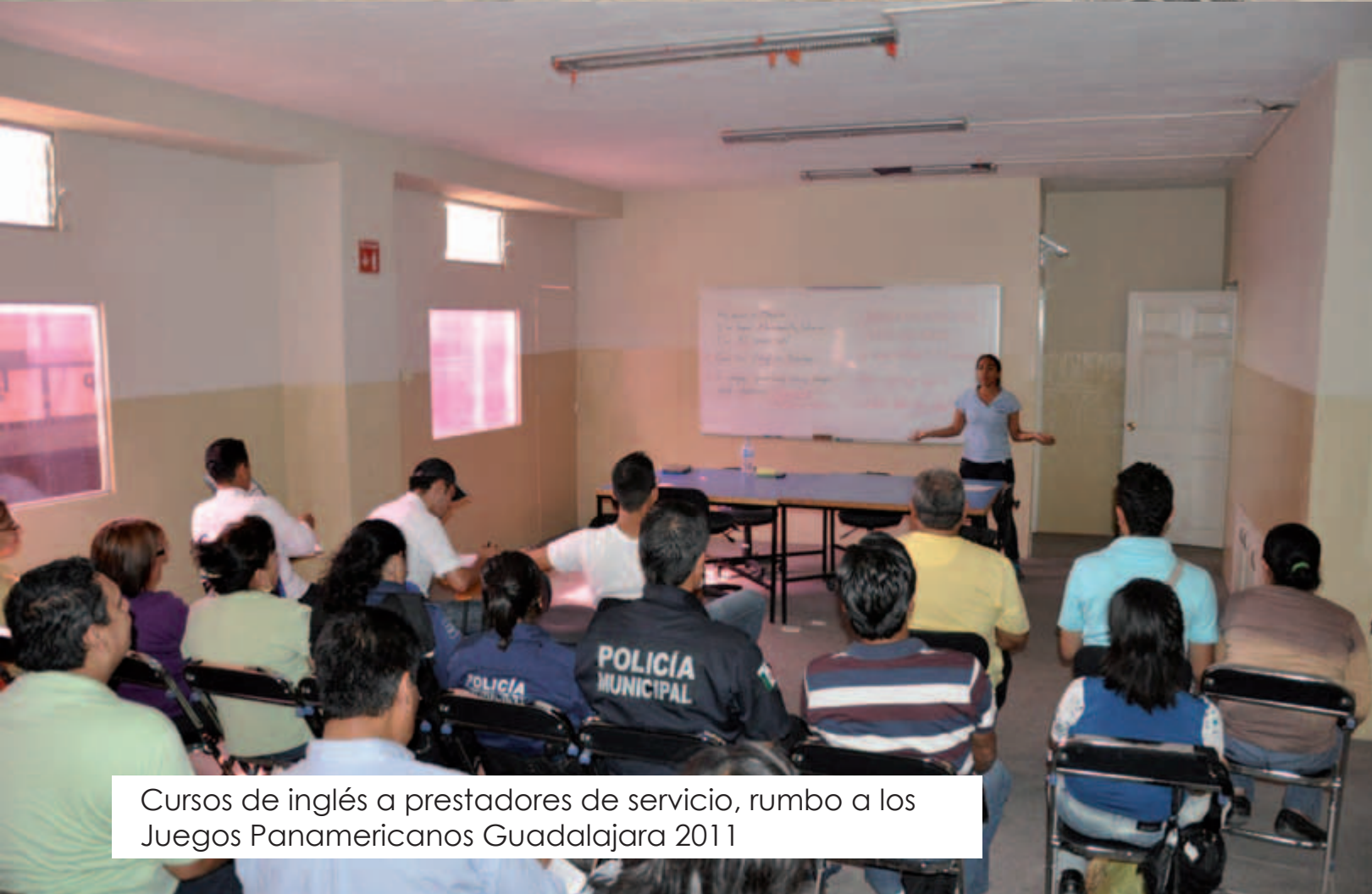
Cursos de inglés a prestadores de servicio, rumbo a los Juegos Panamericanos Guadalajara 2011