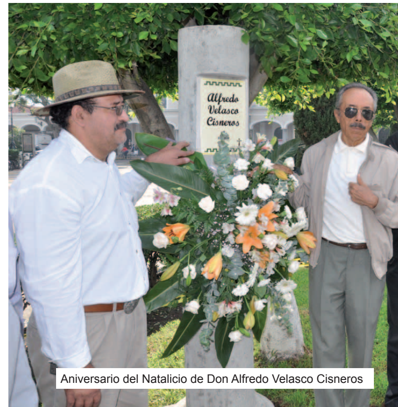
Aniversario del Natalicio de Don Alfredo Velasco Cisneros