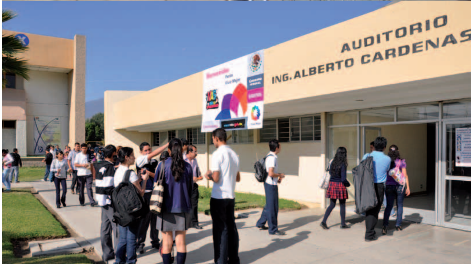
Feria Vivir Mejor