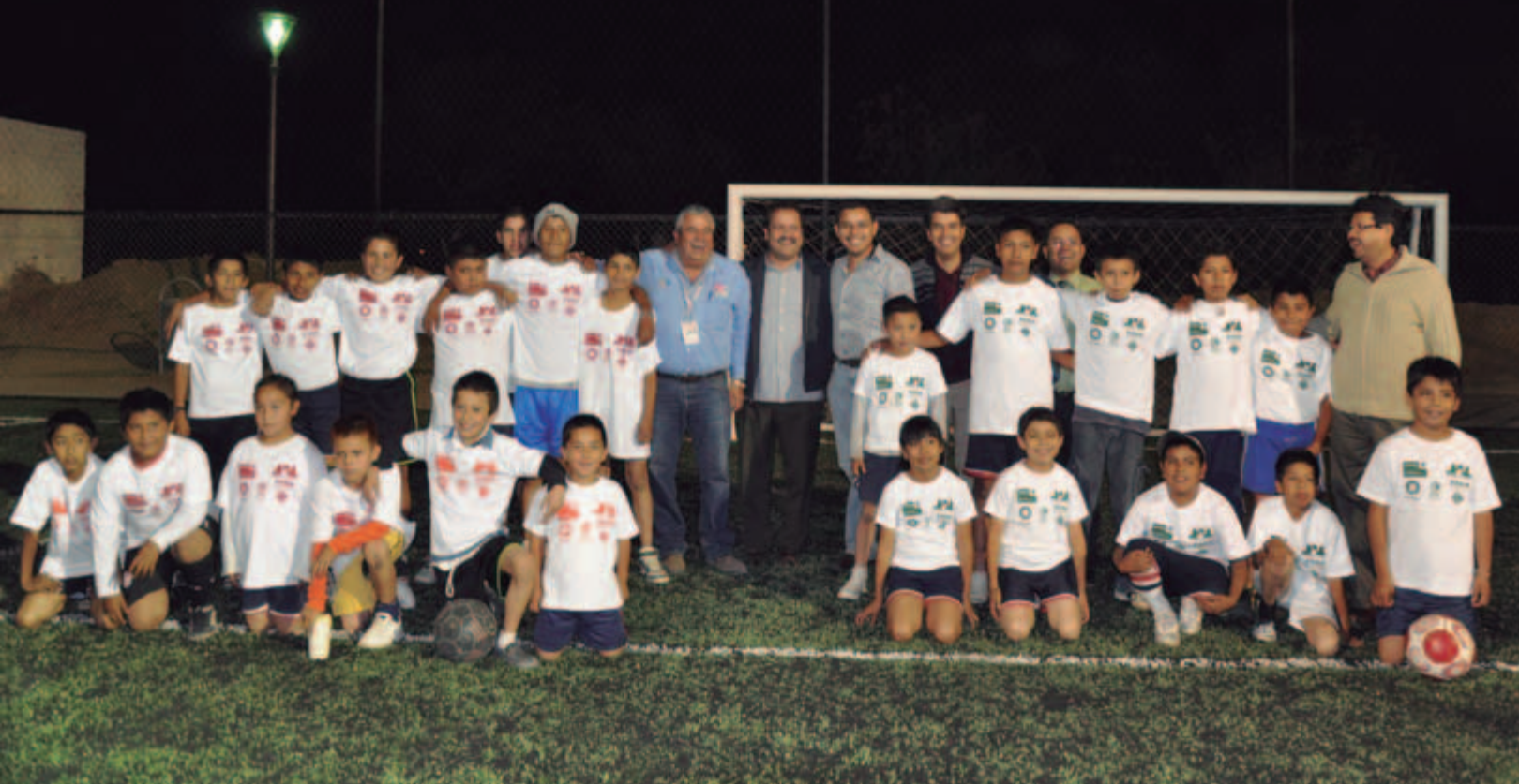
Inauguración del centro deportivo comunitario "Los Fresnos"