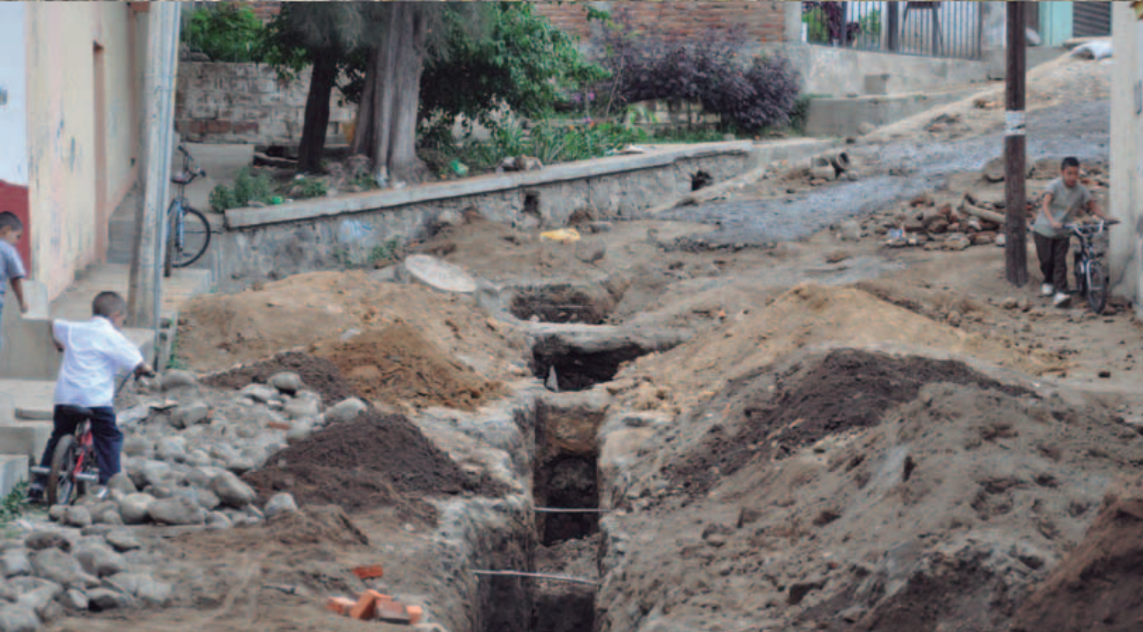
Red de drenaje en la colonia "Cristo Rey"