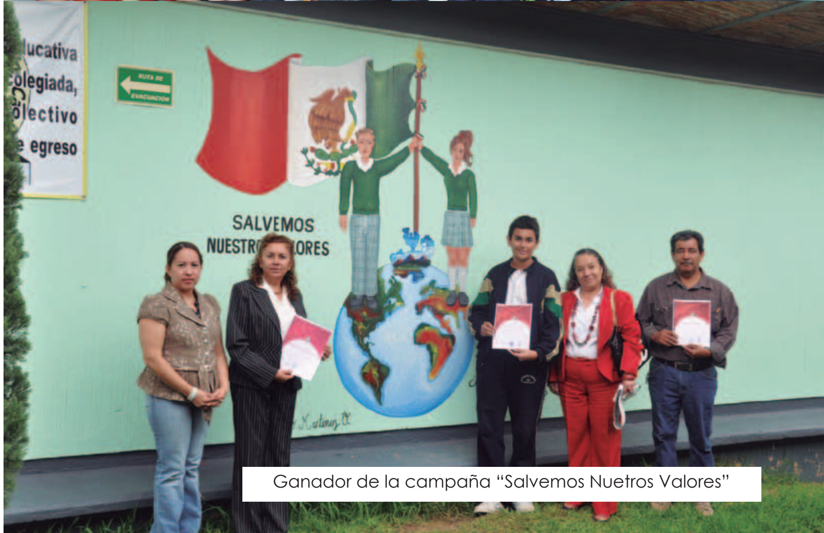
Ganador de la campaña "Salvemos Nuetros Valores"