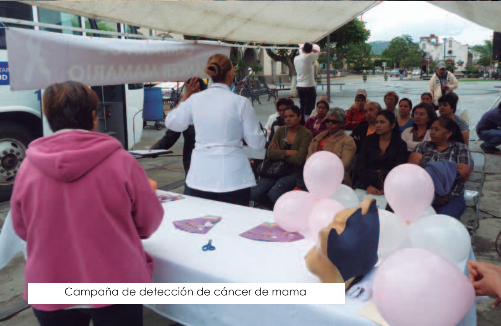
Campaña de detección de cáncer de mama