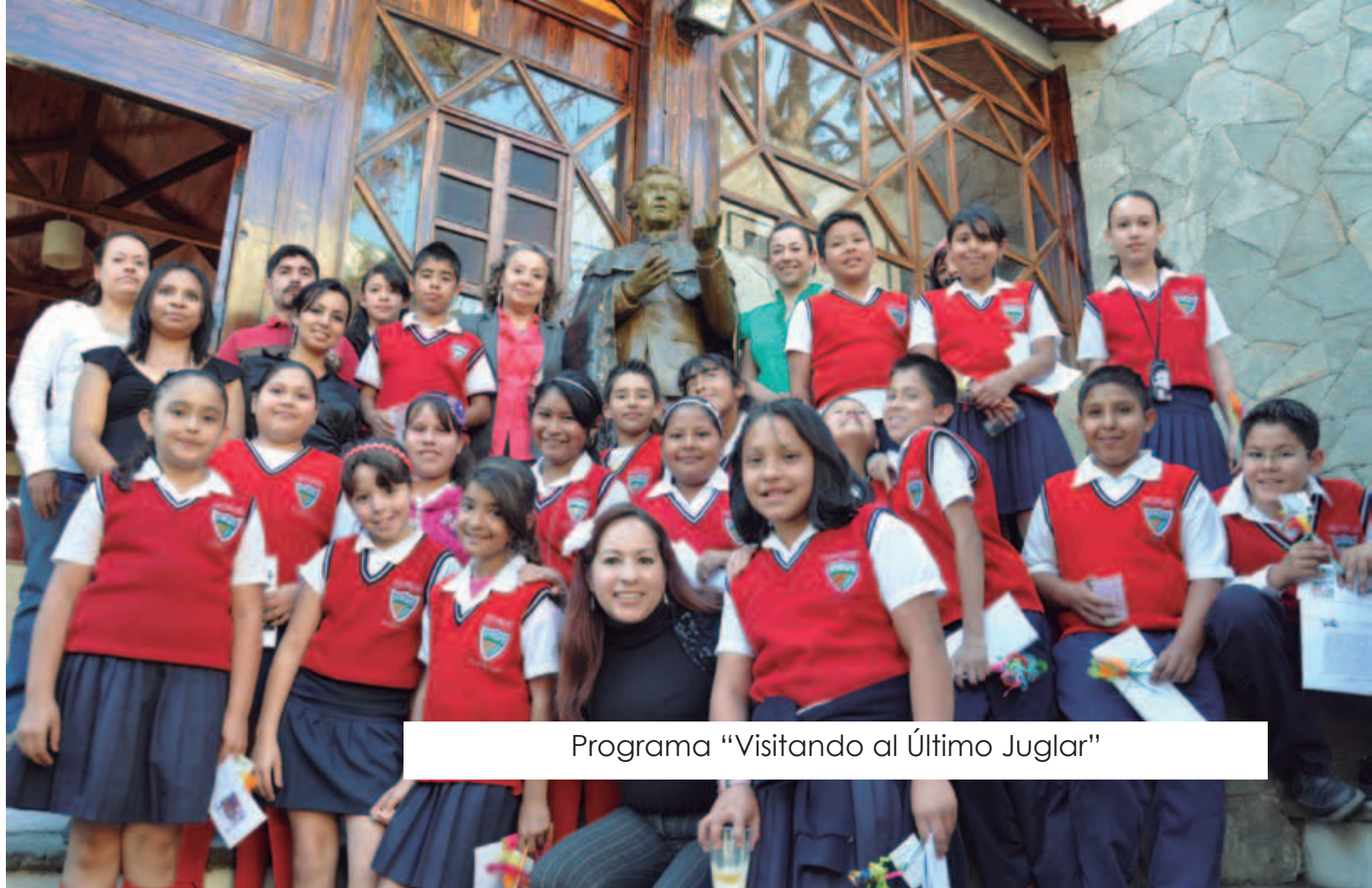
Programa "Visitando al Último Juglar"