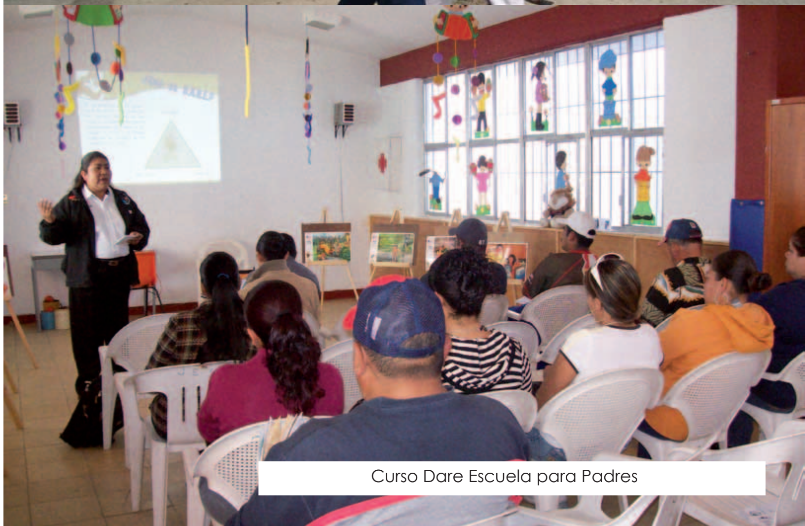
Curso Dare Escuela para Padres