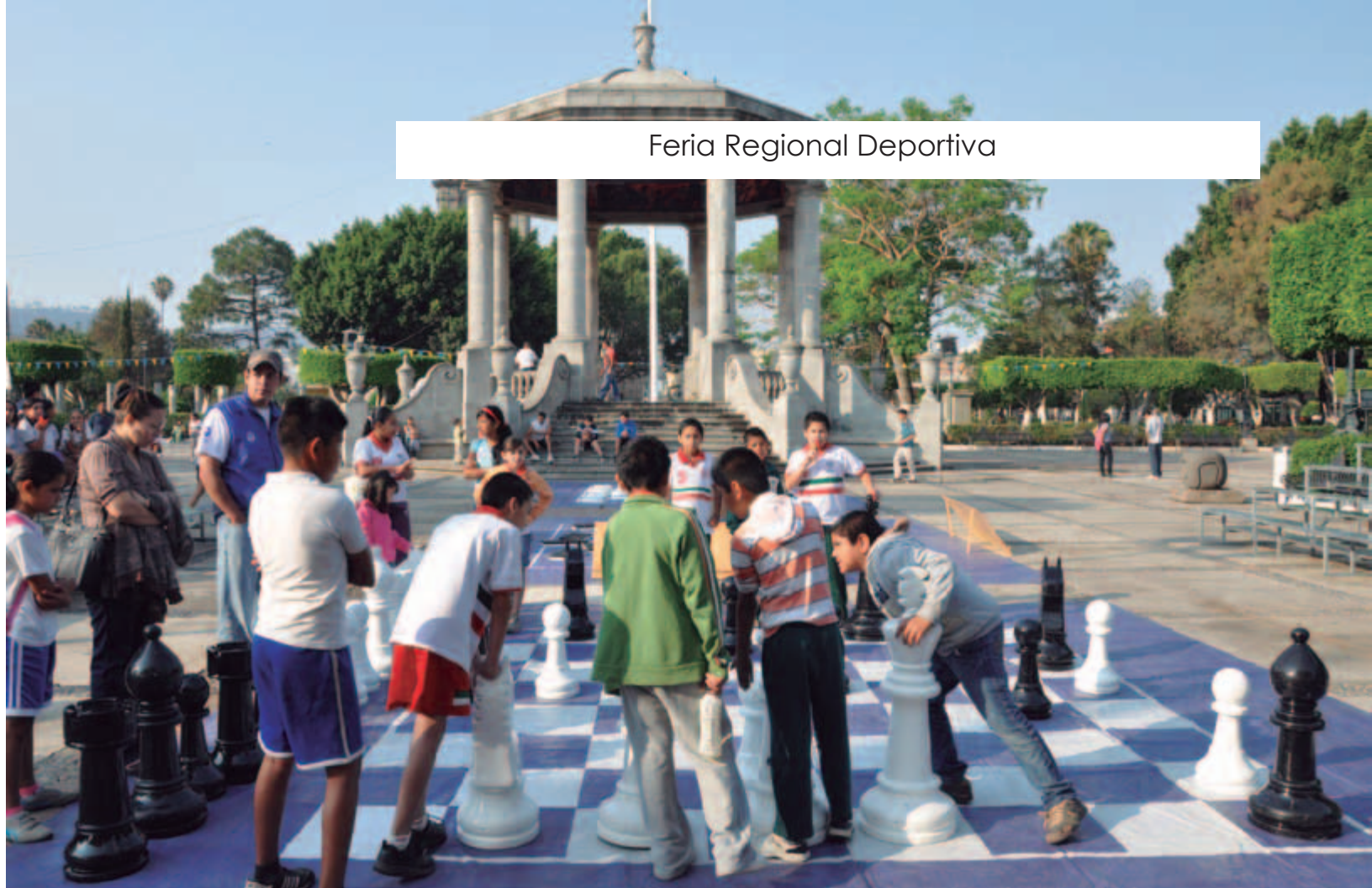
Feria Regional Deportiva