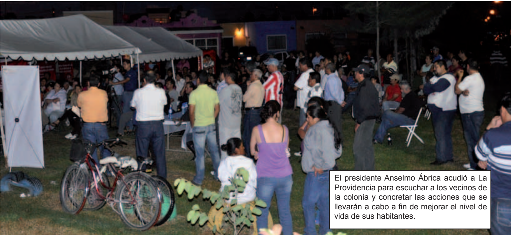
El presidente Anselmo Ábrica acudió a La Providencia para escuchar a los vecinos de la colonia y concretar las acciones que se llevarán a cabo a fin de mejorar el nivel de vida de sus habitantes.