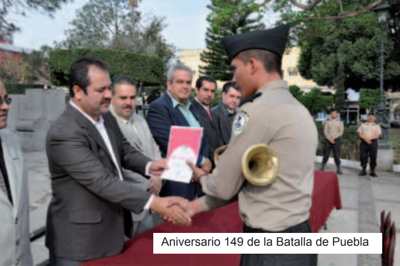
Aniversario 149 de la Batalla de Puebla