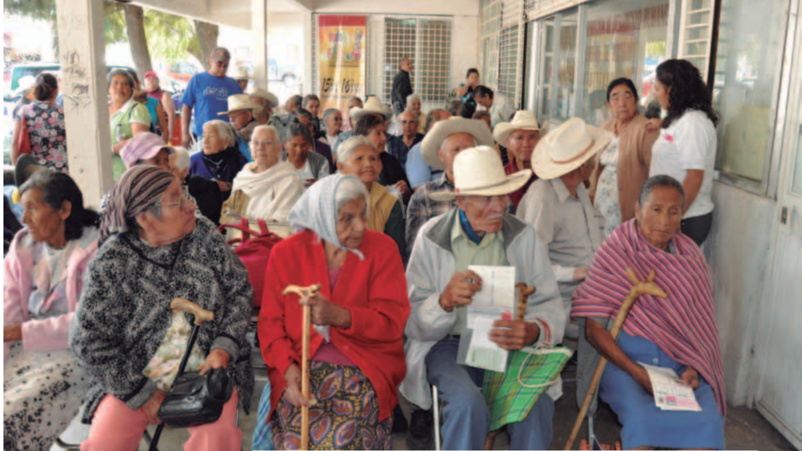
Entrega de apoyos del programa 70 y más