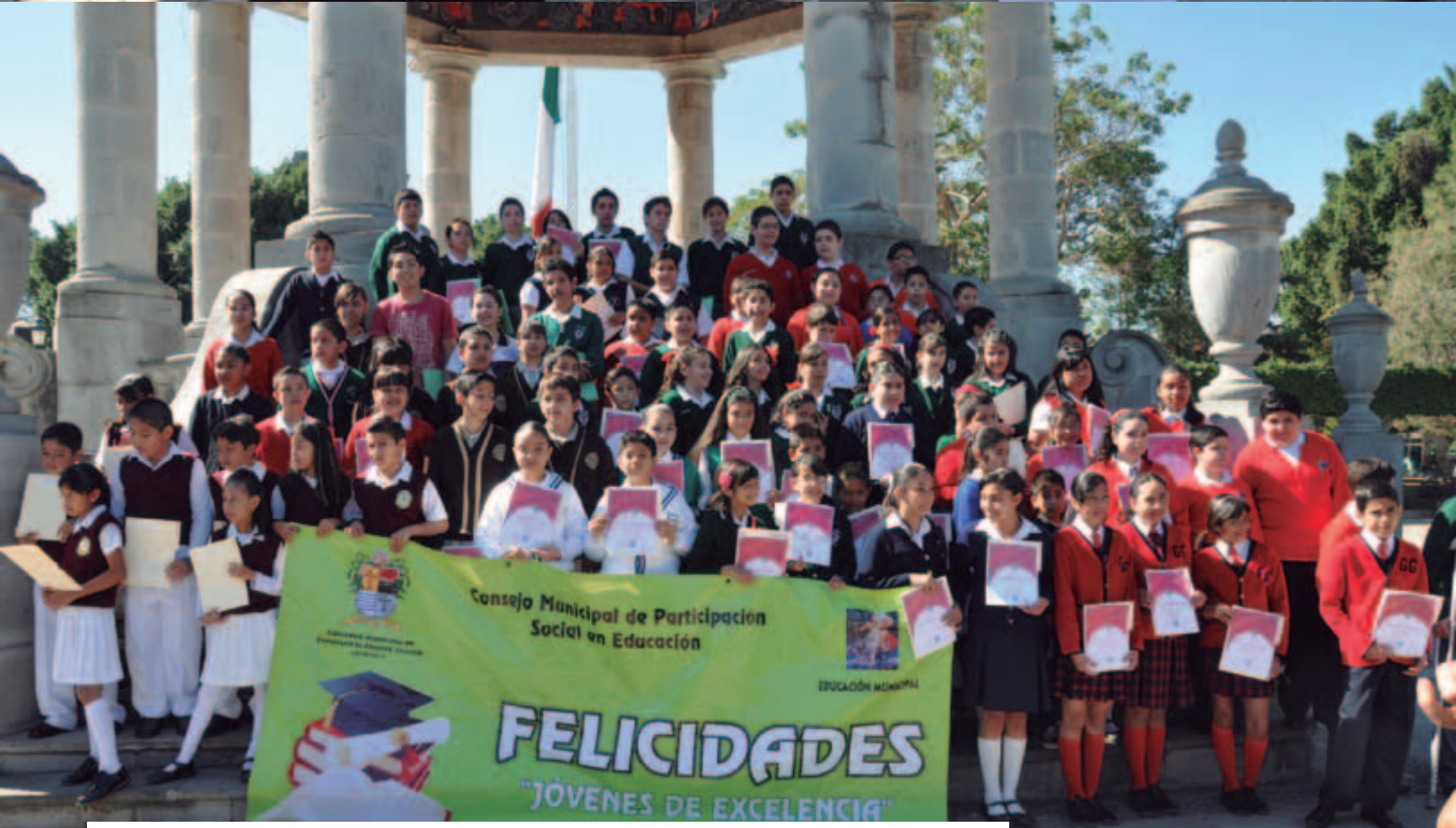
Premiación a Jóvenes de Excelencia