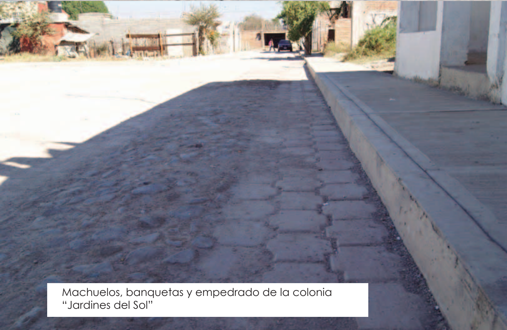
Machuelos, banquetas y empedrado de la colonia "Jardines del Sol"